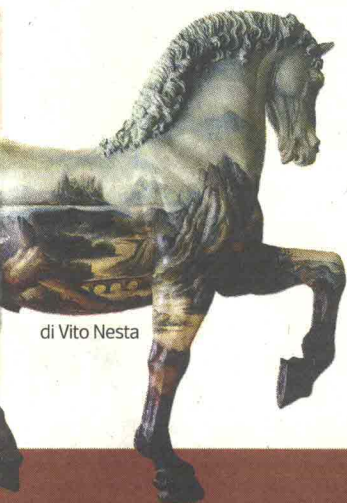
di Vito Nesta