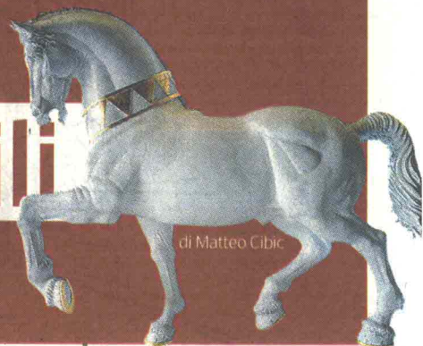
di Matteo Cibic