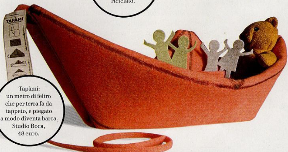
Tapàmi: un metro di feltro che per terra fa da tappeto, e piegato a modo diventa barca. Studio Boca, 48 euro.