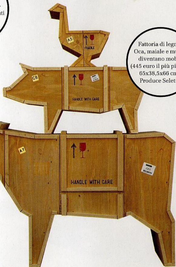
Fattoria di legno. Oca, maiale e mucca diventano mobili (445 euro il più piccolo 65x38,5x66 cm). Produce Seletti.