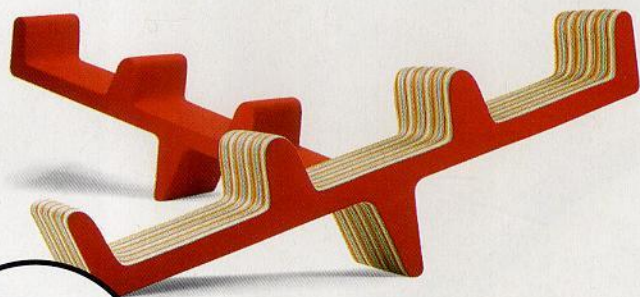
Design danese. Lunga 243 cm, la seduta «ballerina» è rivestita con sei tessuti (Erik Jorgensen, 3.651 euro).