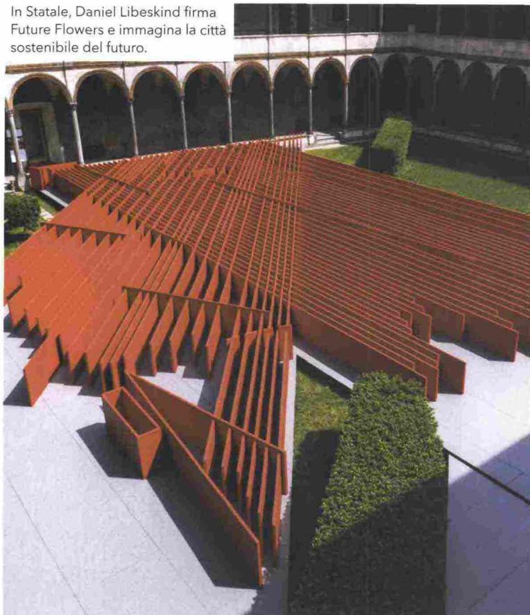
In Statale, Daniel Libeskind firma Future Flowers e immagina la città sostenibile del futuro.