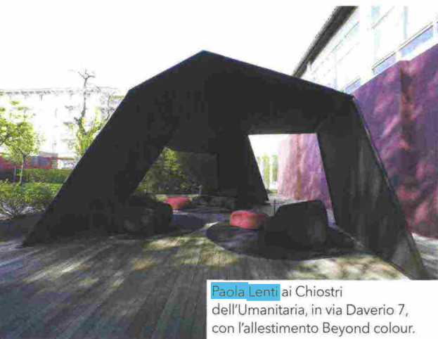
Paola Lenti ai Chiostrini dell'Umanitaria, in via Daverio 7, con l'allestimento Beyond colour.