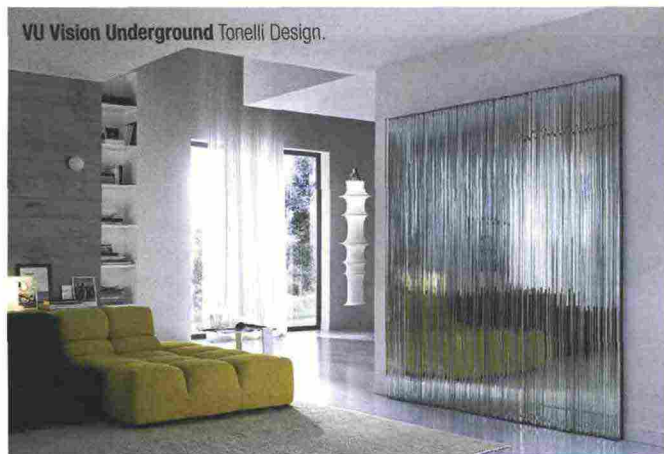
VU Vision Underground Tonelli Design.

Nell'occasione ci fa piacere ricordare qui qualche altro prodotto "collaterale" al nostro settore. Pavillion di Renato J. Morganti per Paola Lenti è un