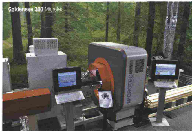
Goldeneye 300 Microtec.