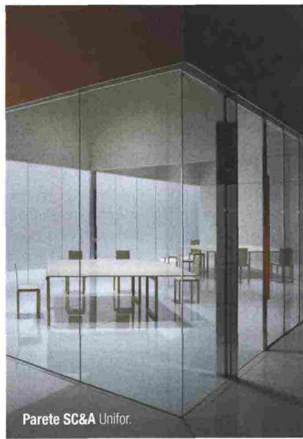
Parete SC&A Unifor.

sistema modulare per godere l'outdoor in alluminio estruso, poliuretano stampato, telo in poliestere o in tessuto. La parete vetrata modulare per suddividere spazi interni Parete SC&A di Pierluigi Cerri per Unifor ha pannelli fissati a soffitto e pavimento lasciando vetro a tuttavista. L'apertura è con scorrevoli a sovrapposizione a pacchetto Goldeeye 300 di Alex Terzariol MM Design per Microtec è uno scanner multisensoriale per la valutazione di componenti in legno. Una macchina di controllo per la misurazione delle dimensioni, l'analisi da colori e lo scattering di profili in legno ad esempio per finestre. VU Vision Underground di Giovanni Tommaso Garattoni per Tonelli Design è uno specchio che trascende la sua funzione. Ogni modulo è composto da 22 elementi di vetro extrachiaro incollati con lampade UV. Il risultato è un'immagine che si frammenta in una infinità di riflessi. Non si può infine dimenticare la presenza nel volume del MUSE il museo di Renzo Piano, sapiente risultato dell'utilizzo di metallo e vetro che abbiamo già ampiamente descritto.