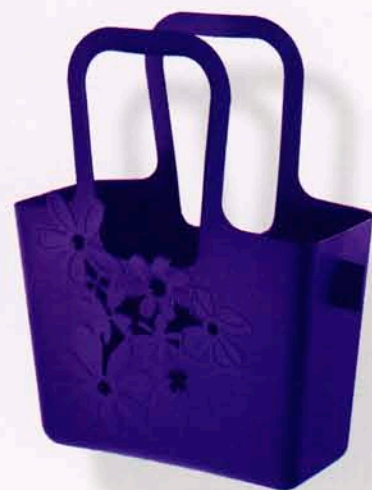
Koziol har väskan Alice i många starka färger. Lämplig för utelivet.