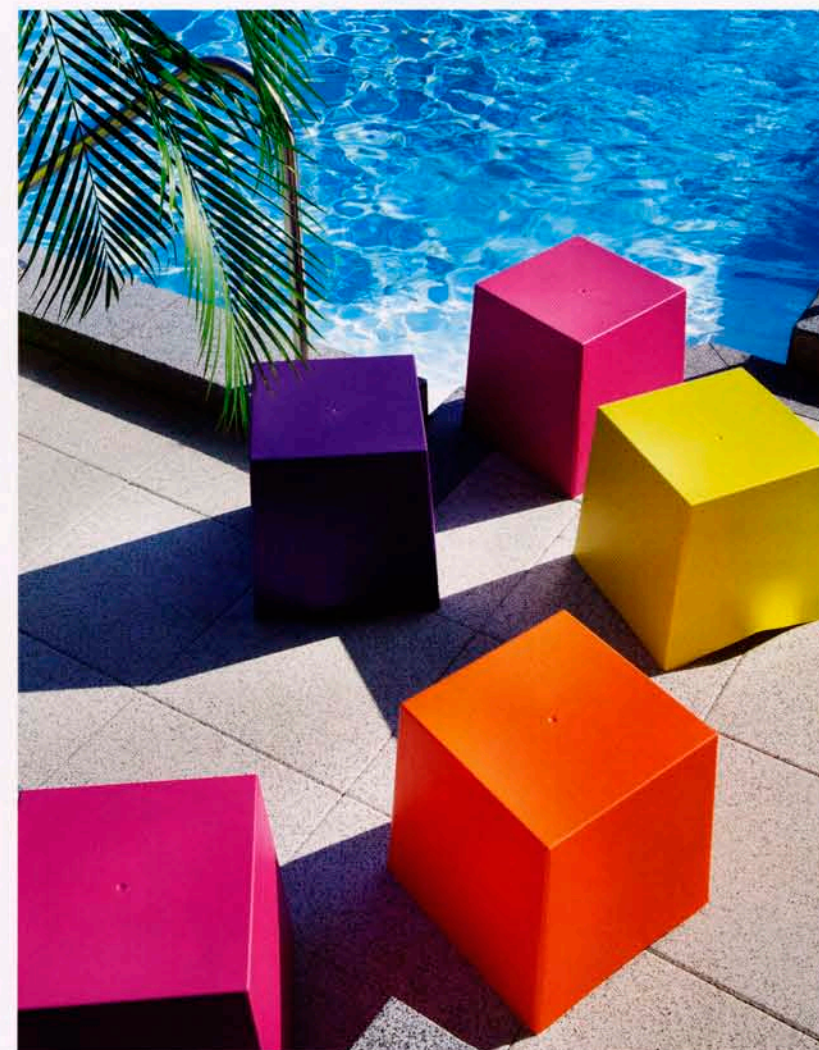
I tyska Koziols sommarkollektion 2011 ingår dessa taburetter kallade Briq i tålig plast. Något för barnkalaset vid poolkanten kanske?