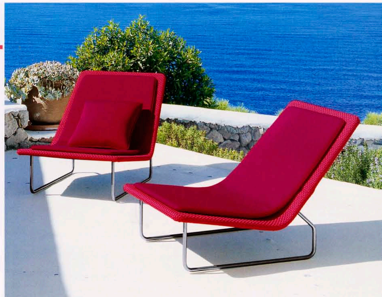
Aqua Sand, design Francesco Rota för Paola Lenti, är en loungefåtölj med en väv av tjocka band. Polyesterlackad ram och rostfritt i synliga delar. Kan stå ute i rusk.