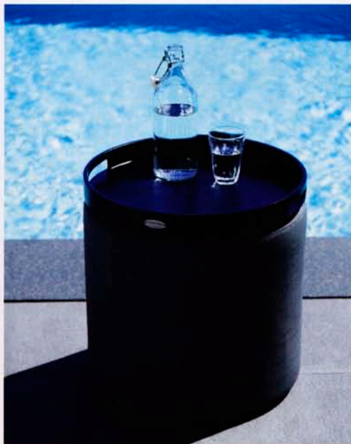
En praktisk ny möbel som kan tjänstgöra som fotpall eller som bord vid sidan av solsängen, tillverkad i slitstarka Cane-line Tex.