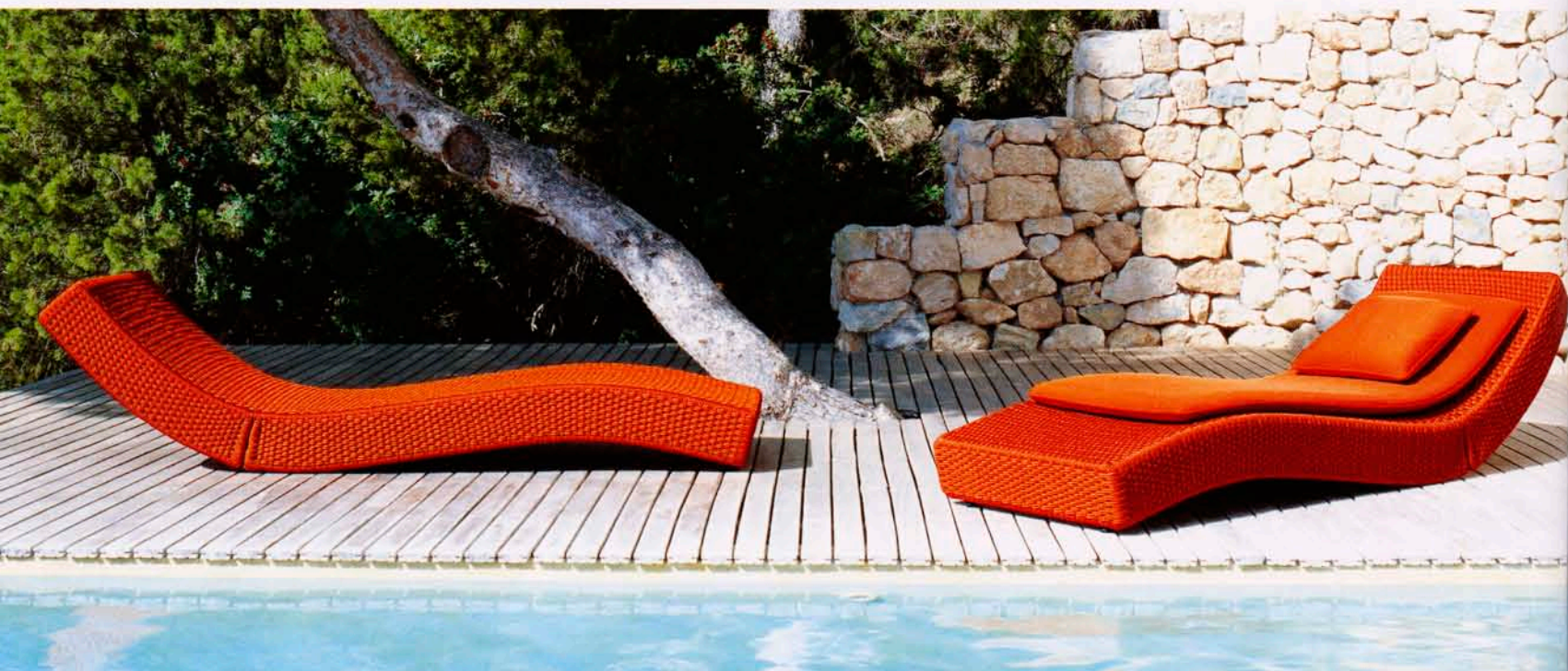
Minimalistiska linjer i Aqua Wave, en schäslong med tre inställningar. Design Francesco Rota för Paola Lenti. Handvävda band har flätats direkt på den polyesterlackade ramen.