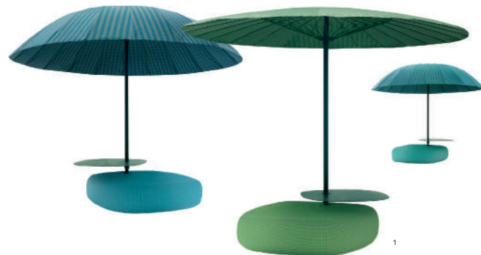
图1、2 这是一款造型新颖的遮阳伞，扎实的底座透出一种休闲感，伞形有平坦款和弯顶款可供选择，如同绿树，形成浓荫，伴你度过盛夏。（Paola Lenti，设计：Fattorini+Rizzini+Partners）

在家门口度假？听起来好像开玩笑，其实刚好相反，这是一个相当靠谱的建议。无论你住的是超大的花园洋房，还是普通的透天公寓，只要有一个固定的安居之所，这就不是天方夜谭。新生代导演张扬的作品《爱情麻辣烫》中，有一对夫妻由演员郭涛和徐帆饰演，他们住在一套面积有限的商品房中，除了一个阳光大好的阳台，其它的可圈可点之处几近于无，但闲暇时，他们还是换上泳衣，戴上墨镜，把家当成海滩，晒起太阳，感受和风的吹拂。相比之下，我们当中又有多少心境浮躁，因而忽略了自家门前的美景了呢？