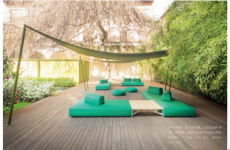
图6 Ala是一款户外遮阳篷，它的支撑杆采用了钢结构，遮阳顶盖是用Madras布料制成的。（Paola Lenti，设计：Bestetti Associati）