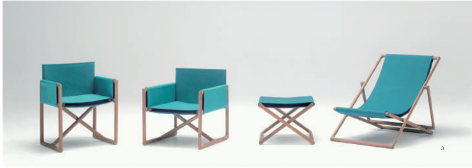
图3 Portofino折叠椅系列是由两把扶手椅、一张折叠躺椅以及一张折叠凳组成的。它们的椅套有多种款式可供选择。（Paola Lenti，设计：Vincent Van Duysen）