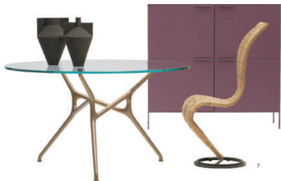
图7 草编的S椅形态自然延伸如同雕塑，已经成为 Cappellini 的标志，与青铜结构的 Branch tables 相组合，出现了材质和色彩上的碰撞，拥有别具一格的优雅气息，呈现出经典的时代特征。（Cappellini，设计：Tom Dixon）