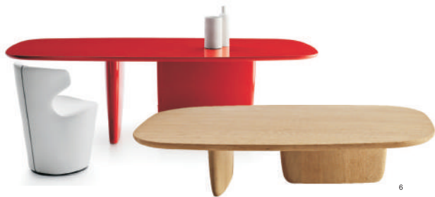
图6 TOBI-HSH打破了传统的桌子造型，它最独特的亮点就是非对称的支撑结构，其边缘都采用了圆润平滑的设计，是一款实用却不失时尚的桌子。（B&B Italia，设计：Edward Barber&Jay Osgerby）