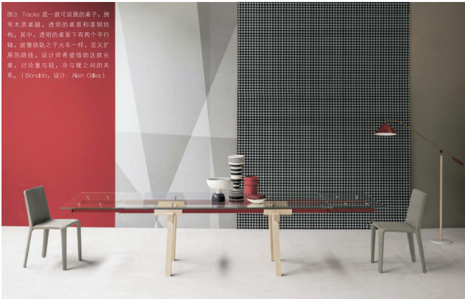
图3 Tracks 是一款可延展的桌子，拥有木质桌腿，透明的桌面和漆钢结构。其中，透明的桌面下有两个平行轴，就像铁轨之于火车一样，定义扩展的路线。设计师希望借助这款长桌，讨论重与轻，冷与暖之间的关系。（Bonaldo，设计：Alain Gilles）