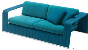
图4 Frame是一款组合式沙发，其框架的造型独特而大气，搭配防水的椅垫，非常适合放置在户外。（Paola Lenti，设计：Francesco Rota）