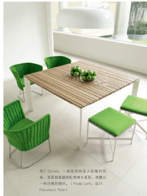
图7 Sunset，一款能容纳多人就餐的餐桌，漆面钢桌腿搭配黄樟木桌面，透露出一种诗意的情怀。（Paola Lenti，设计：Francesco Rota）