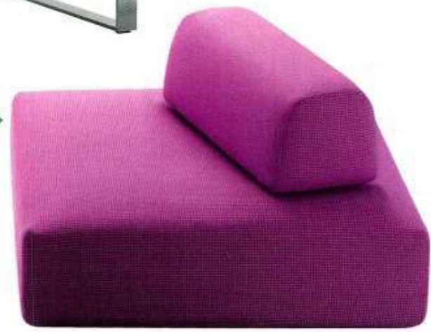
“Orlando”, chauffeuse composée d’une plateforme avec structure en inox et matelas mousse, dossier/accoudoir lesté, housse outdoor, 4 tailles, L. 95 x P. 95 x H. 31 cm, Paola Lenti , à partir de 2 655 €.