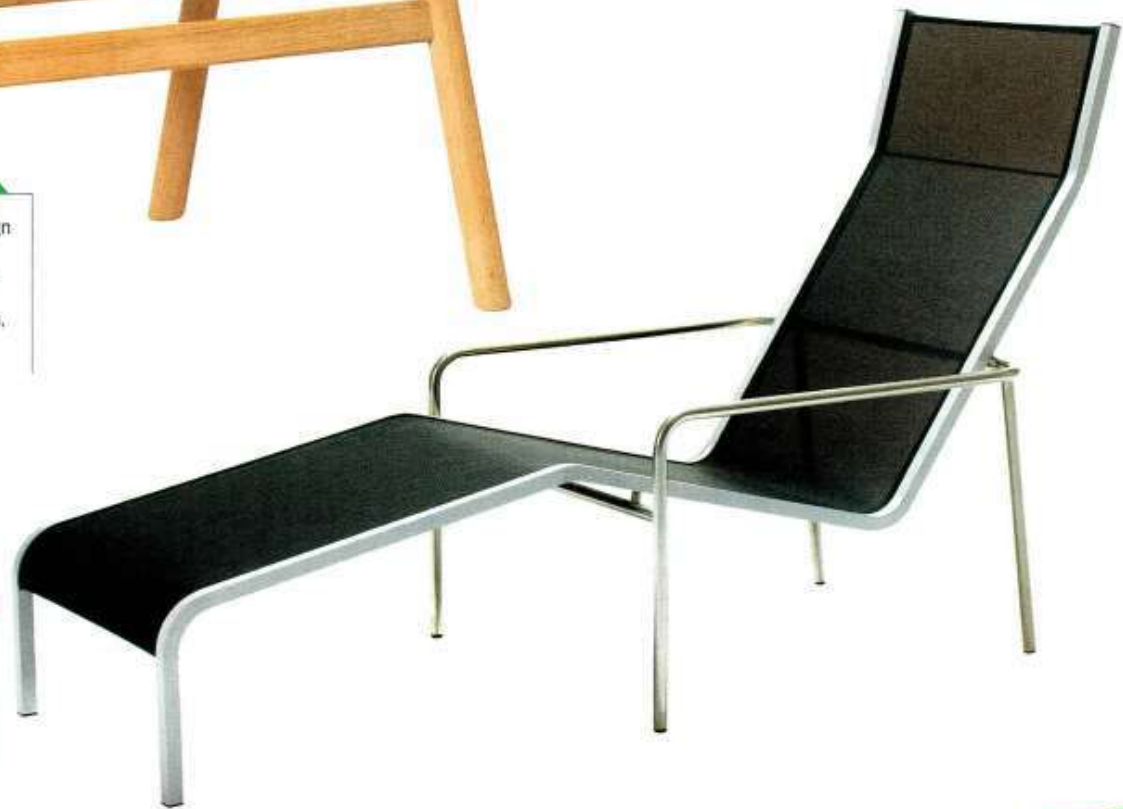
“Extempore Lounge chair”, design Arnold Mercks, en bois massif Jatoba, aluminium et acier inox, empilable, L. 158 x l. 65 x H. 91 cm, Extremis , 1 440 €.