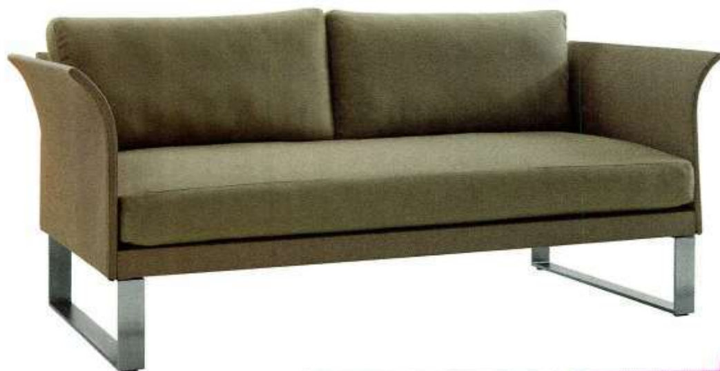
“Komfy”, design Éric Carrère, structure d’assise, de dossier et d’accoudoirs en Textylène® 100 % outdoor, coloris blanc ou taupe, pieds en acier inoxydable, L. 150 x P. 75 x H. 68 cm, Sifas , à partir de 1 900 €.