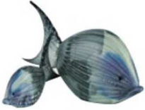
La Murrina dekoratif cam balıklar: 215-410 Euro, Labirent Konsept.

Amerikalı oyuncu, model ve iş kadını Jessica Alba, doğal güzelliğini ön plana taşıyan, fazlalıklardan arınmış bohem kurguları tercih ediyor. Yaşanmış ve yıpranmış görünümlü tasarımlar, günümüze uyarlanmış geleneksel dokular onun stil kodları arasında.