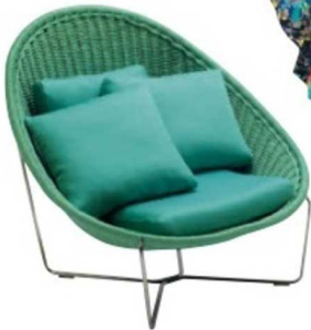
Paola Lenti marka Nido koltuk ve puf 7.370 Euro+KDV, Mozaik.