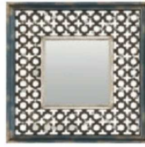
Duvar aynası: 525 TL, Mudo Concept.