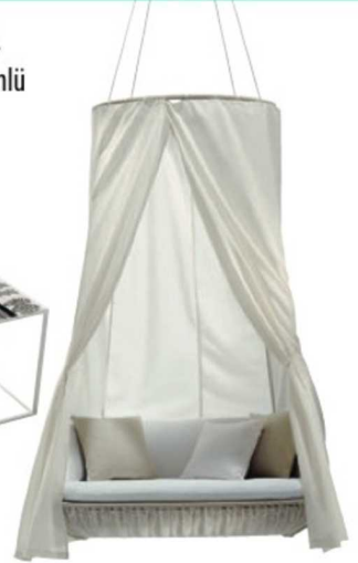
Dedon marka Swing Us koltuk, İCA.