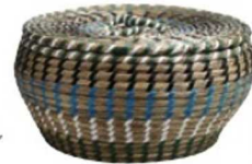
Kapaklı sepet: 179 TL., BoConcept.