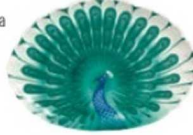
Tabak: 149,95 TL., Zara Home.