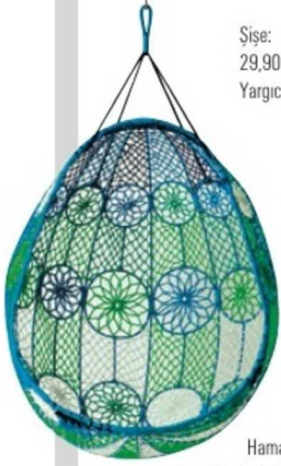
Şiše: 29,90 TL, Yargıcı.