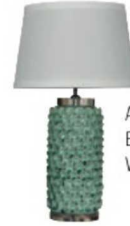
Pafume kanepesi: 2.650 TL., Mudo Concept.