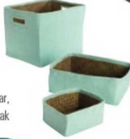
Kutular: 155 TL, Crate and Barrel.