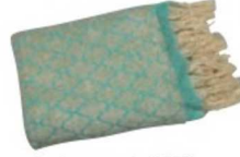
Havlu peştamal: 120 TL, Sea Shell.