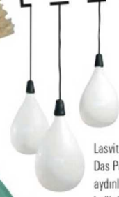
Lasvit marka Das Pop serkıt aydınlatma, fiyatı belli deđil, Tepta.