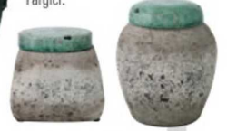
Dekoratif küpler: (tanesi) 59,90 TL, Yargıcı.