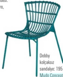
Dobby kolçaksız sandalye: 195 TL., Mudo Concept.