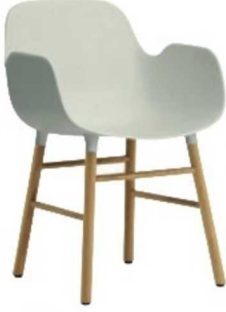
Normann Copenhagen marka Simon Legald tasarımı Form sandalye: 355 Euro, Diseno.