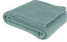
Koltuk şalı: 219,95 TL, Zara Home.