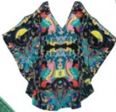
Mojo Lavinia plaj elbisesi: 357 Euro, Lazul.