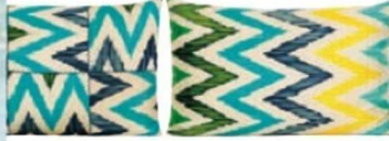
Yastıklar: 265 TL., Yastık by Rifat Özbek.