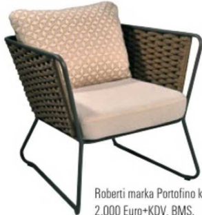
Roberti marka Portofino koltuk: 2.000 Euro+KDV, BMS.