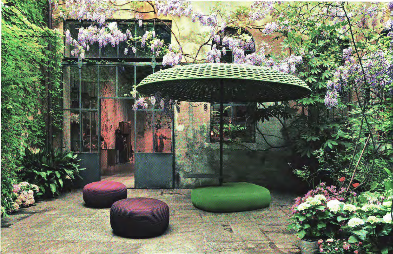
GROSSER SONNENSCHIRM „MOGAMBO“ AUS HANDGEWEBTEM WASSERFESTEM SPEZIALGARN, UM 14 100 EURO, POUFS „OTTO“, JE AB 810 EURO, ALLES VON PAOLA LENTI