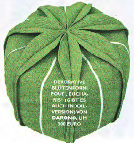
DEKORATIVE BLÜTENFORM: POUF „EUCHARIS“ (GIBT ES AUCH IN XXL-VERSION) VON DARONO, UM 300 EURO

REALISATION: Christiane Wirthensohn.