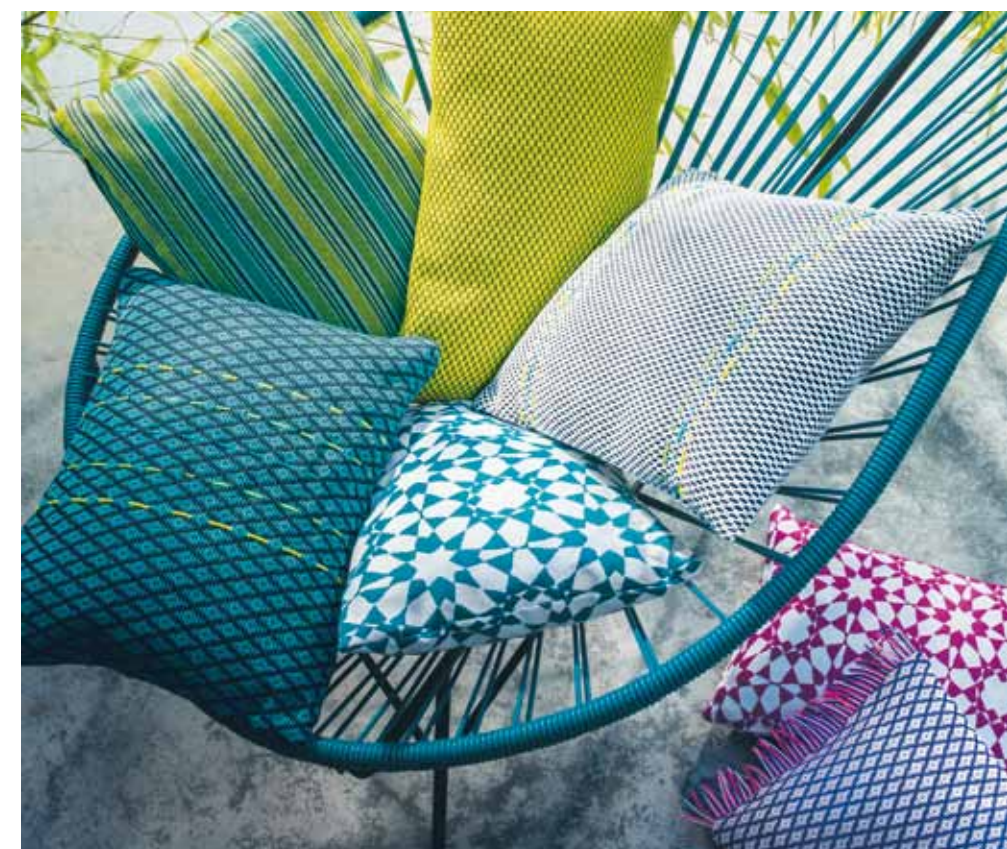
Sofistikerad enkelhet är det i nya utomhuskollektionen Cala Rossa från Casamance. Här ser vi några kuddar klädda med tyger ur Cala Rossa. Jacquarder och vävar, tillverkade i Europa i 100 procent polypropylen, är resistenta mot UV-strålning, salt, klorin och alla sorters väder.