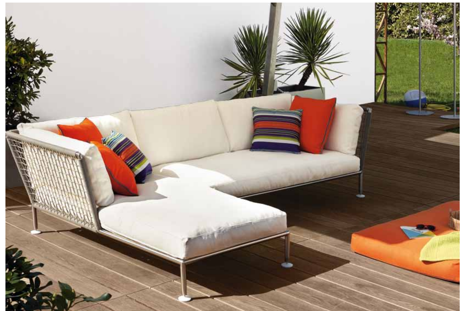
Italienska Coro leker gärna med färger som här i den vita soffan Nest, designad av Stefano Gallizioli. Färgstarka kuddar i orange med turkos keder och randiga dito i många toner, allt skapat för utomhusmiljön.