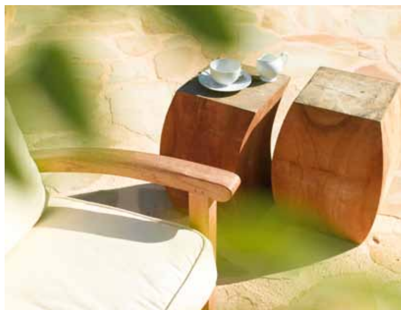
Twins kallas Tribùs roliga småbord i massiv teak. Egentligen är det Hon och Han som tillsammans bildar en organisk enhet.