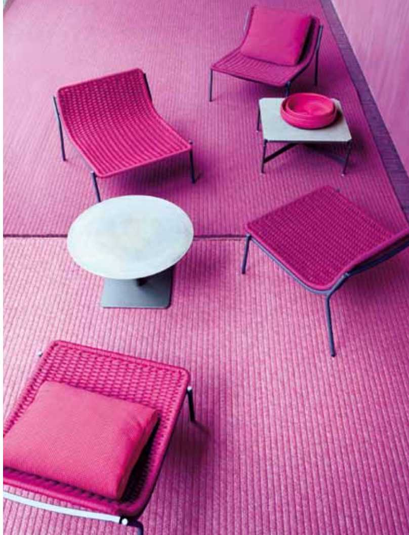
Starka färger är det i de nätta stolarna kallade Baia i vattenavvisande Rope eller Aquatech. Rostfritt stål bildar stommen. Design Francesco Rota. Mattan ton i ton är väderbeständig och vattenavvisande och går under beteckningen High Tech Rugs.