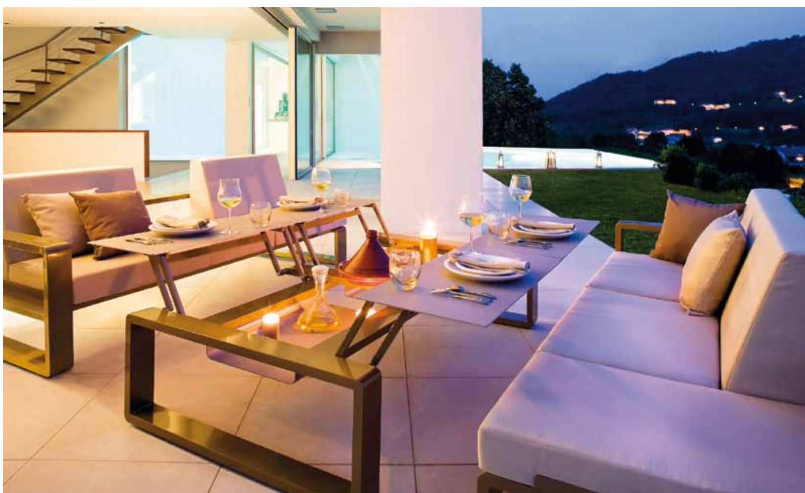
Här är Ego Paris serie Kama som matmöbel på terrassen. De smarta uppfällbara borden har flera positioner. För Ego Paris är praktiska användningsområden viktigt vid sidan om själva formen.