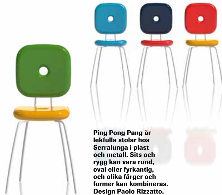
Ping Pong Pang är lekfulla stolar hos Serralunga i plast och metall. Sits och rygg kan vara rund, oval eller fyrkantig, och olika färger och former kan kombineras. Design Paolo Rizzatto.