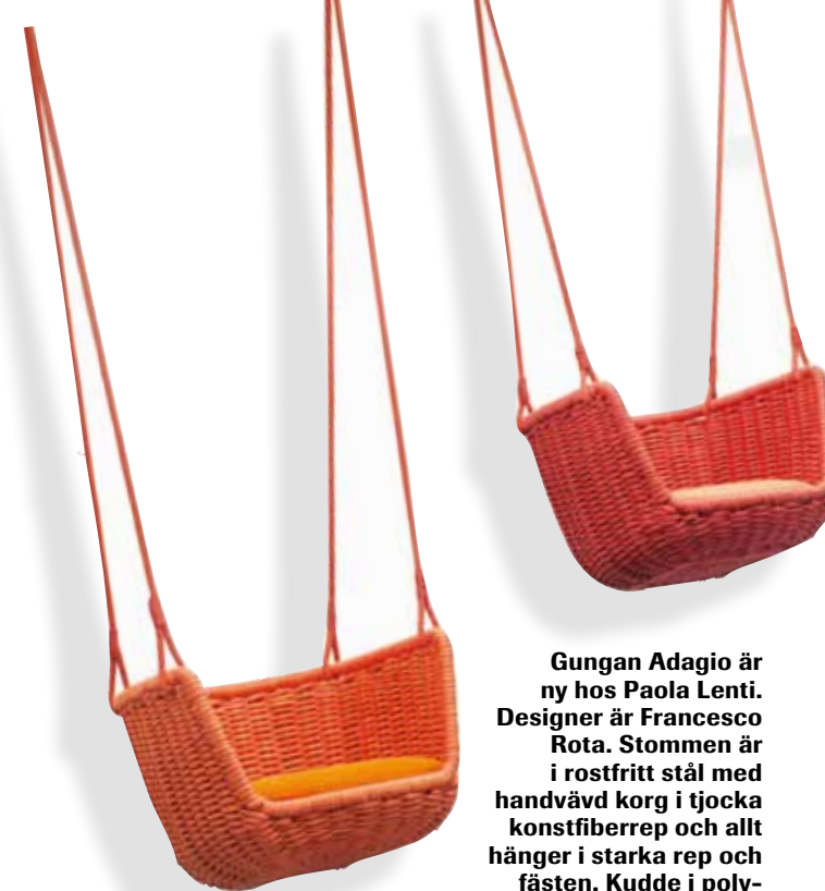
Gungan Adagio är ny hos Paola Lenti. Designer är Francesco Rota. Stommen är i rostfritt stål med handvävd korg i tjocka konstfiberrep och allt hänger i starka rep och fästen. Kudde i polyuretan med polyesteröverdrag.