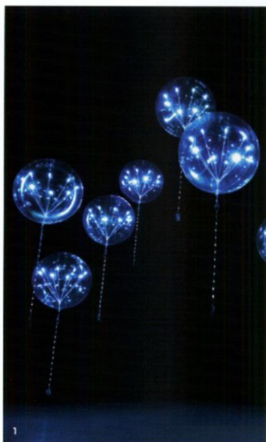
1/ Les ballons luminescents du studio anglo-japonais Tangent. 2/ Vue du showroom Moda. 3/ Projet « Dye it yourself » du think tank Takt Project.