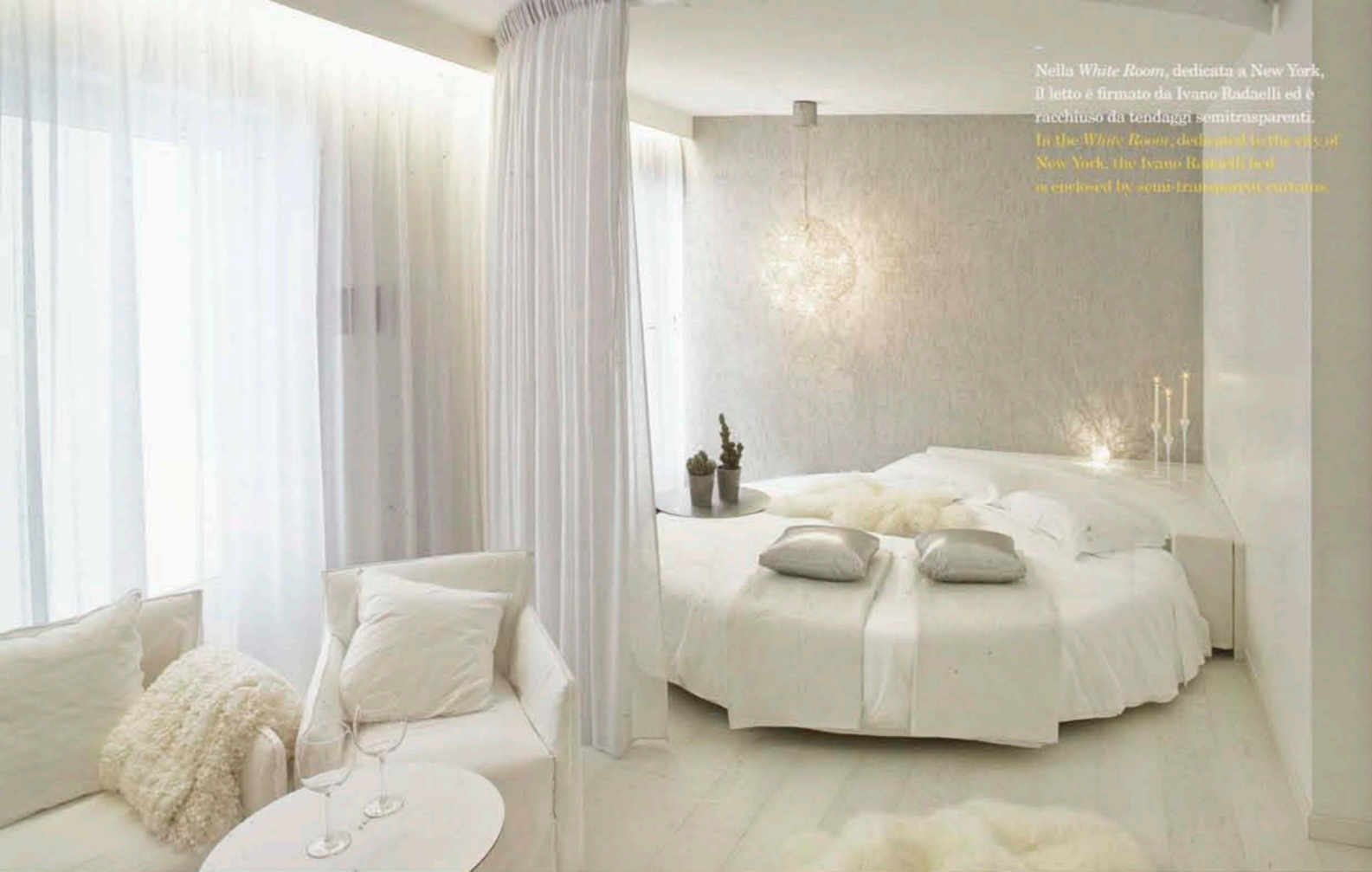
Nella White Room , dedicata a New York, il letto è firmato da Ivano Radaelli ed è racchiuso da tendaggi semitrasparenti. In the White Room , dedicated to the city of New York, the Ivano Radaelli bed is enclosed by semi-transparent curtains.

to Giovanna Cortivo si è occupata della ristrutturazione edile e dello studio degli spazi, mentre i due designer Marco Sbalchiero e Alessio Bassan hanno curato gli arredi delle camere. Il gioco di materiali e disposizione di luce realizza vere e proprie scenografie, regalando sogni tridimensionali dentro i quali ci si muove. Secondo un'idea di bellezza che armonizza tecnologia all'avanguardia e rispetto per l'ambiente. La reception si affaccia sull'ascensore panoramico in vetro che porta alle camere, così da non perdere lo sguardo sulle Dolomiti; ad accogliere gli ospiti, un bancone in legno di abete, lampade Moooi e Tolomeo e pavimento in resina. Tokyo, New York, Londra... sono solo alcune delle città che dettano le linee di progettazione delle singole camere che parlano attraverso il linguaggio delle grandi capitali. La città di Tokyo vive dentro la Zen Room , arredata sui contrasti di chiaro e scuro con pezzi in legno di Gervasoni e illuminata con corpi lampada Viabizzuno, camino e tende in legno di ispirazione orientale. La zona benessere ha una doccia