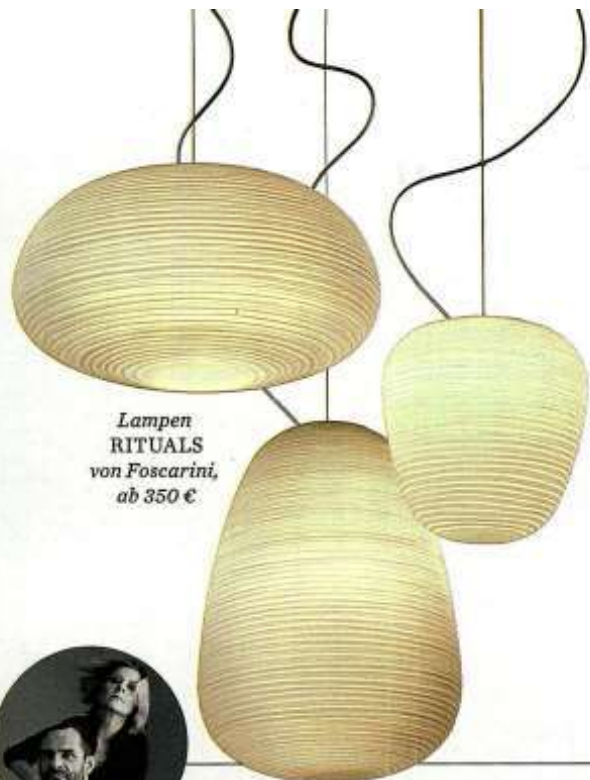
Lampen RITUALS von Foscarini, ab 350 €