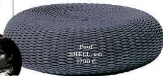
Pouf SHELL, um 1700 €