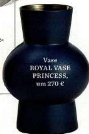
Vase ROYAL VASE PRINCESS, um 270 €

Ihre Inspirationsquellen: die organischen Formen der Natur und die Farben der venezianischen Lagune, wo die 52-Jährige lebt und arbeitet. Ihre in Handarbeit gefertigten Keramikschalen, Vasen und Teller bezaubern durch Purismus und Poesie.