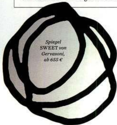
Spiegel SWEET von Gervasoni, ab 655 €

... führt das Erbe seines Vaters, des legendären Mailänder Gestalters Piero Fornasetti, fort. Seine Entwürfe sind poetisch, surreal und auf humorvolle Weise zeitlos. Interior-Schmuckstücke mit hohem Wiedererkennungswert!