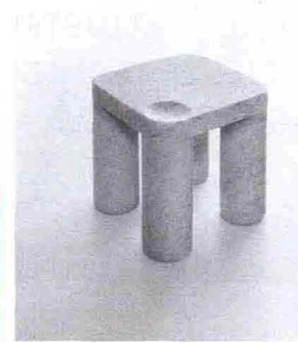
11— Soft Marble