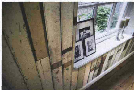
6— Wallpaper Revolution