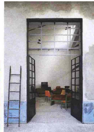
8— Opening Exhibition Revival