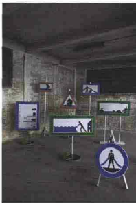
10— Designhub 50