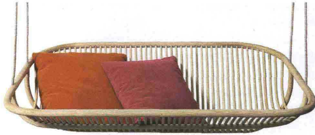
1— Paola Lenti 2012