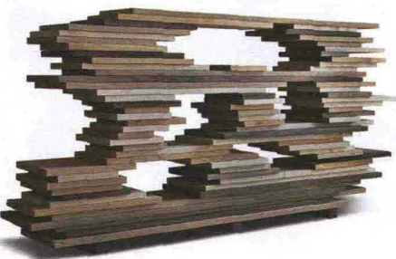
4— Morelato tra le righe