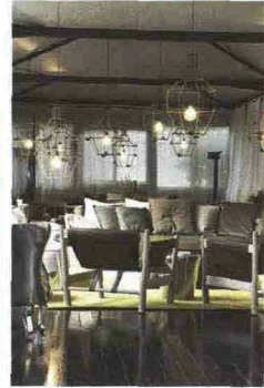
9— Hclub > Diana New Dehors