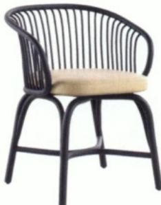
HUMA van Mario Ruiz voor Expormim, prijs op aanvraag.