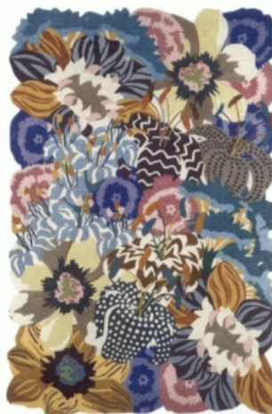
RAJMAHAL van Missoni Home, € 4.450.