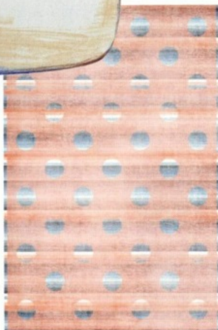
BLEND van Scholten & Baijings voor Amini, prijs op aanvraag.