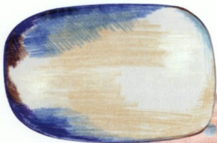
SCRIBBLE van Front for Moood Carpets, € 1.099.