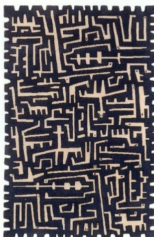
CILIOPHORA van Maarten Baas voor Nodus, € 4.000.