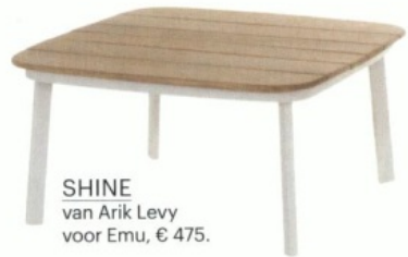
SHINE van Arik Levy voor Emu, € 475.