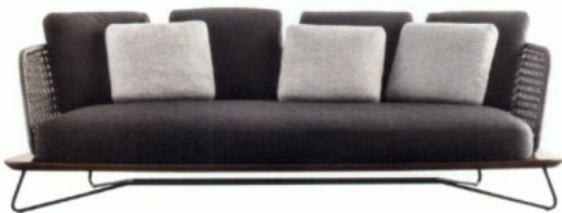
RIVERA van Rodolfo Dordoni voor Minotti, v.a. € 6.860.