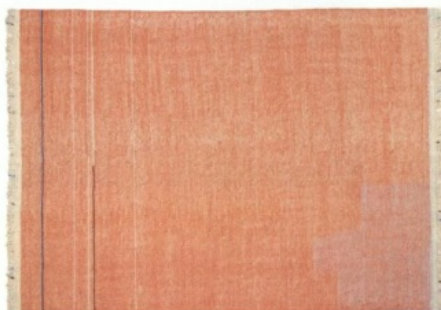
ARGALI van Hella Jongerius voor Danskina, v.a. € 2.772.