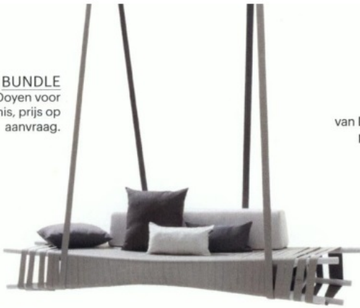
BUNDLE van Lionel Doyen voor Extremis, prijs op aanvraag.