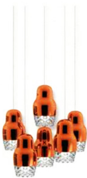
AXO LIGHT Fedora

Gleich eine ganze Reihe von neuen Leuchten präsentiert Axo Light als Messeneuheiten in Mailand. Fedora heißt eine der Familien, zu der mehrere Pendelleuchten und Einbaustrahler gehören. Die hängende Leuchte gibt es mit einem, drei, sechs und zwölf Leuchtkörpern sowie in einer Version mit sieben Leuchtkörpern. Die Schirme der Fedora-Pendelleuchte sind aus Aluminium in metallic Bronze oder Rotgold gefertigt, das in ein Endstück aus geschliffenem Klarglas übergeht. (Preis auf Anfrage)