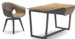
GINGER AND FRED, POLTRONA FRAU