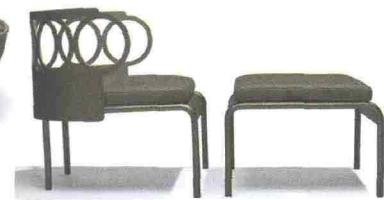
WEATHER BY WILLIAM SAWAYA