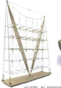
VELIERO BY CASSINA