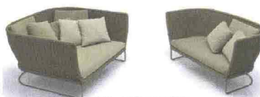
AMI, PAOLA LENTI