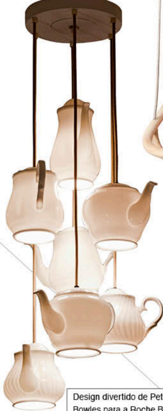
Design divertido de Peter Bowles para a Roche Bobois. Ele transformou em luminária sete diferentes bules de chá