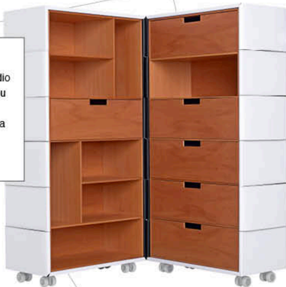
Inspirado nas caixas mágicas chinesas, o estúdio Front desenvolveu para a Porro um armário que muda o acabamento conforme o movimento de