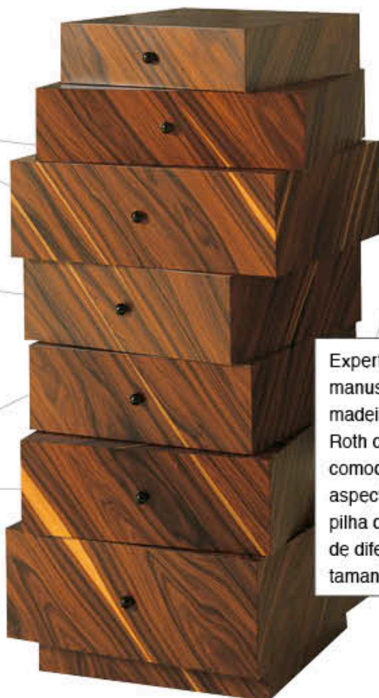
Experts no manuseio da madeira, a Roth criou esta comoda com aspecto de uma pilha de gavetas de diferentes tamanhos