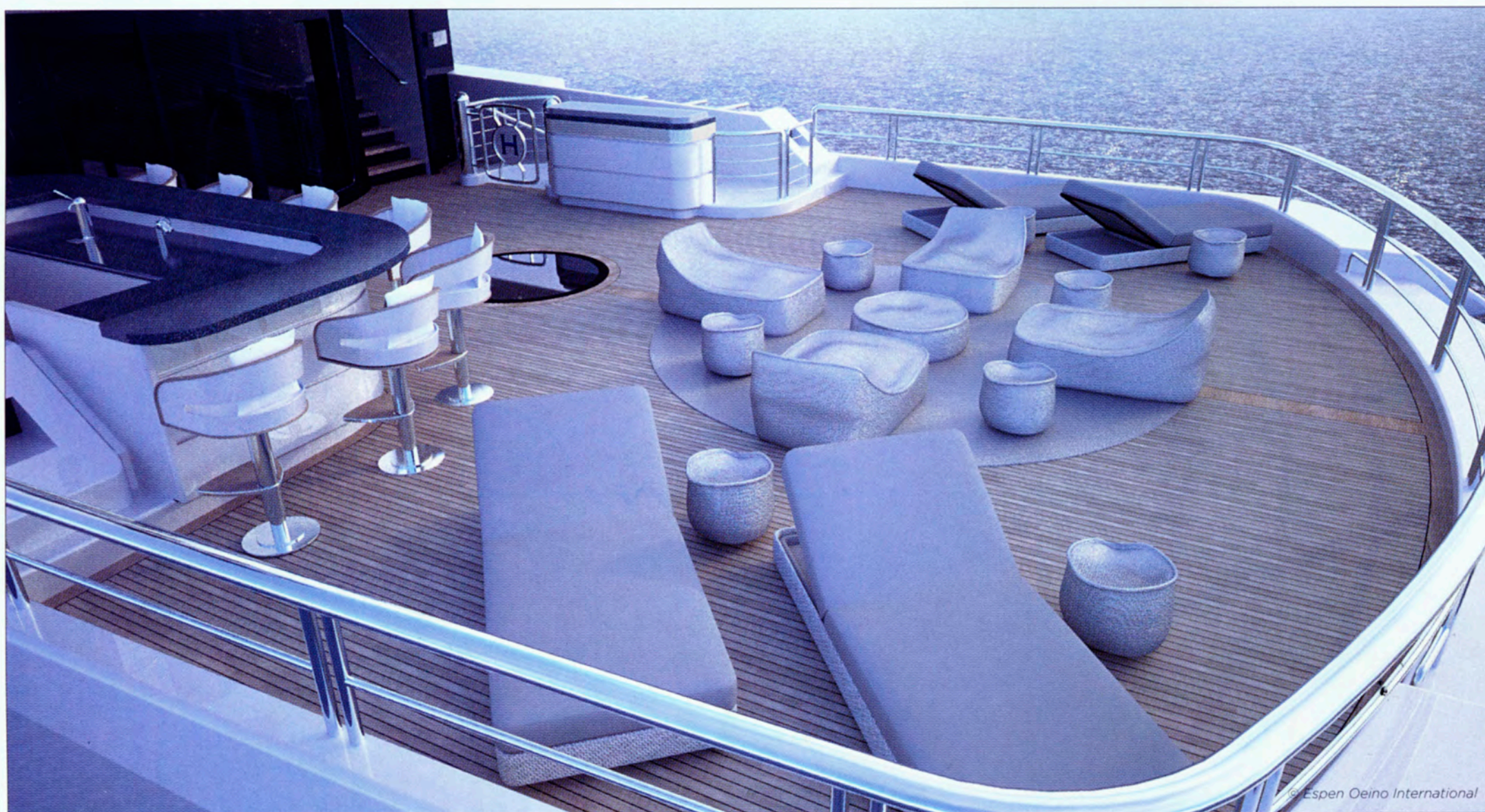
Espen Oeino signe le mobilier extérieur fixe des yachts qu'il dessine, dans un style très contemporain avec de beaux matériaux.