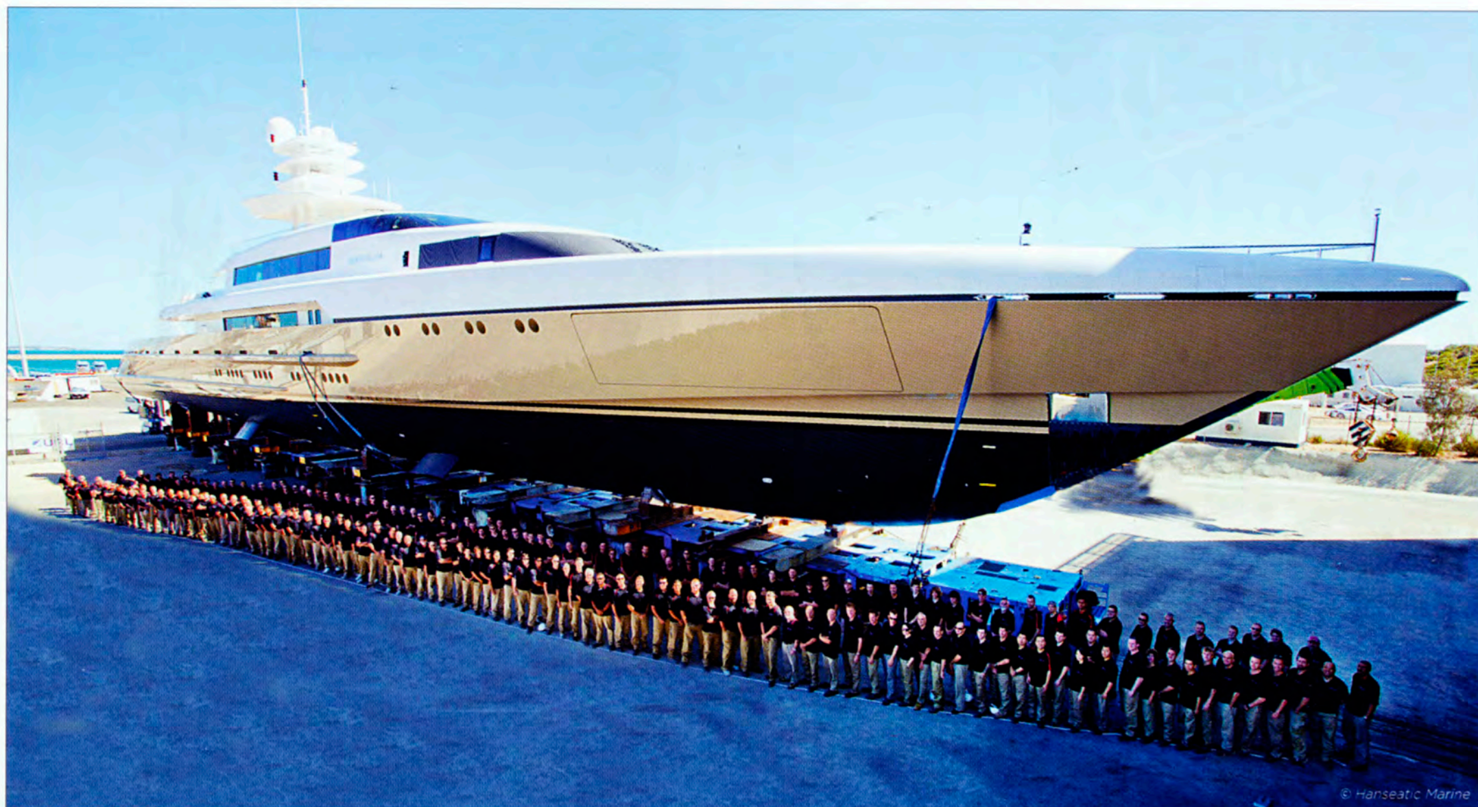
Le Smeralda (ci-dessus) est un 77 mètres qui a été mis à l'eau le mois dernier. Comme le Silver et le Silver Zwei, il est léger, bas et compte peu de ponts. - Perspectives du Stella Maris (ci-dessous) avec trois ponts à l'avant, et seulement deux à l'arrière.