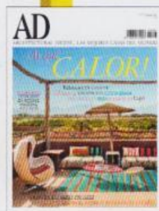
EN PORTADA 'Vintage' vestido de textil tribal, alfombras coloristas y fresca en el hotel 'Fellab', en Akkara (Marrakech).