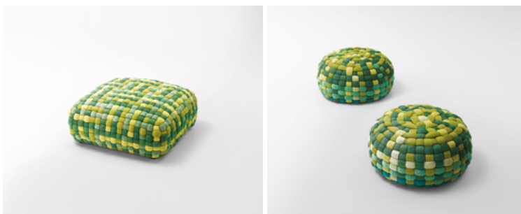
Tobit , design Paola Lenti CRS

Poufs de dimensions et formes différentes. Le rembourrage en microsphères de polypropylène est pourvu d'un revêtement déhoussable tressé à la main avec la maille tubulaire Chain Outdoor, une exclusivité Paola Lenti pour l'extérieur.