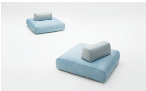
Hopi , design Paola Lenti CRS

Pouf de différentes dimensions et formes. Le rembourrage en microsphères de polypropylène et polyuréthane est pourvu d'un revêtement déhoussable en tissu Maris. Les poufs Hopi peuvent être complétés par des dossiers librement positionnables.