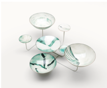
Ebe , design Paola Lenti CRS

Petite table composée d'une structure en acier verni sur laquelle reposent des bols en cuivre de dimensions différentes. Les bols, qui peuvent également être utilisés comme récipients indépendants, sont émaillés à la main avec des motifs abstraits et des coloris obtenus avec un mélange de poudres et de pigments.