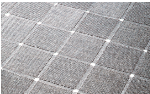
Net 10, Net 20 , design Paola Lenti CRS

Tapis modulable pour l'extérieur et l'intérieur obtenu avec des éléments en tissu Maris de 10 ou 20 centimètres de large. La surface du tapis est formée de bandes parallèles espacées, superposées de façon orthogonale et jointes entre elles.