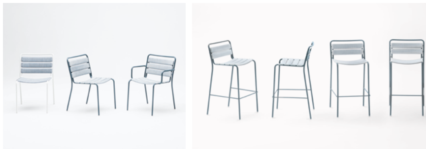
Elba , design David Rockwell

Sedia con o senza braccioli, poltroncina e sgabello bar impilabili in acciaio inox verniciato e doghe strutturali portanti in Diade. Le sedute Elba nascono dalla trentennale esperienza nel settore hospitality dell'architetto e designer americano David Rockwell e sono state progettate con particolare attenzione per l'uso in ambienti pubblici.