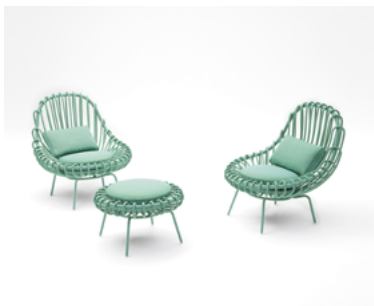
Giunco , design Francesco Bettoni

Fauteuil et pouf. La structure portante en aluminium est revêtue à la main d'une tresse en fil Twiggy. Les assises sont complétées par des coussins en polyuréthane et fibre de polyester recyclée revêtus des tissus outdoor de la collection.