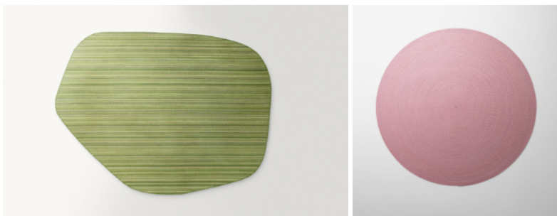
Parallelo, Zoe , design Paola Lenti CRS

Tapis pour l'extérieur et l'intérieur réalisés à la main en cousant des cordes de fil Twiggy dans le sens de la longueur ou en spirale et disponibles dans les dizaines de coloris de la collection.