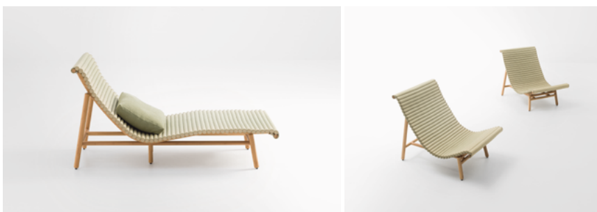
Shibusa , design Francesco Rota

Fauteuil et chaise longue. La structure en bambou tourné est associée à une assise en igusa, un matériau naturel à la fois résistant et délicat, qui mûrit avec le temps sans perdre ses caractéristiques structurelles, passant d'un coloris vert clair à une teinte jaune paille. Les caractéristiques particulières de ce matériau nécessitent que les chaises Shibusa soient utilisées exclusivement à l'intérieur.