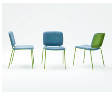
Nina , design Francesco Rota

Chaise empilable composée d'une base en acier inoxydable et de panneaux de support pour l'assise et le dossier imprimés en Diade, formée pour rappeler la tradition des chaises rembourrées : un concept intemporel, renouvelé dans les détails et les matériaux qui, combinés avec la fonctionnalité et l'élégance loin de la mode, rend Nina idéale pour les projets contract et résidentiels.