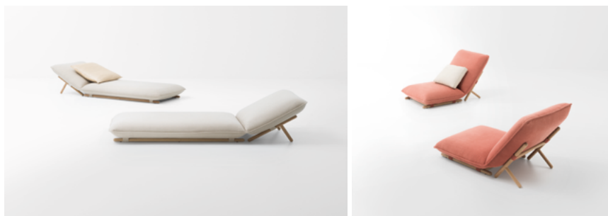
Hiro , design Francesco Rota

Fauteuil et chaise longue. Les grands coussins d'assise et de dossier, disponibles avec rembourrage naturel - en latex, fibre de paineira et feutre de laine - ou synthétique, en fibre de polyester recyclé et polyuréthane, et recouverts de tissus de lin ou de chanvre, sont soutenus par une structure en bois de sassafras qui permet au dossier de prendre deux positions, une plus confortable pour la lecture, une dédiée à la détente.