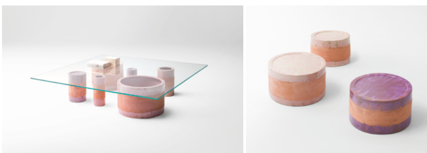
Cerchi , by Nicolò Morales

Petites tables individuelles en faïence ou avec plateau rond ou carré en verre trempé extralight et base formée d'éléments cylindriques en faïence de différentes dimensions réalisés et décorés à la main avec des coloris exclusives par Nicolò Morales.