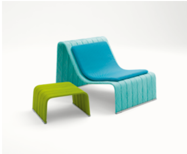
Frame , design Francesco Rota

Une collection historique, composée de sièges modulaires, plateformes, fauteuils, chaises longues, chaises, bancs et tables est renouvelée grâce à l'utilisation de nouvelles tresses en fil Twiggy, qui recouvrent les structures essentielles de la série, formées par des profilés en aluminium, en plus que les tresses traditionnelles en fils Rope et Aquatech.