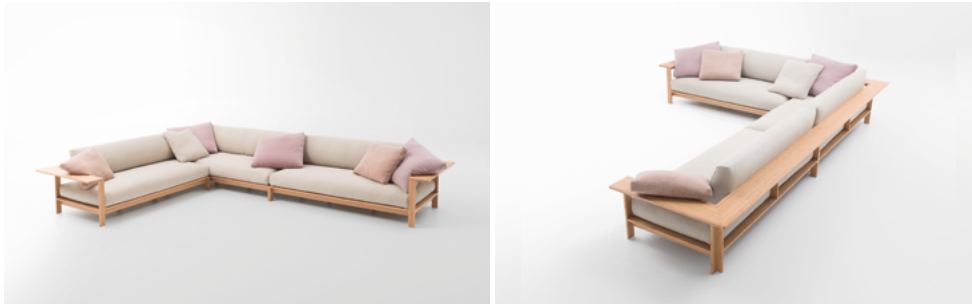
Frei , design Francesco Rota

Canapé trois places et éléments modulaires. La structure en panneaux de bambou accueille des coussins d'assise et de dossier disponibles avec un rembourrage naturel - en latex, fibre de paineira et feutre de laine - ou synthétique, en fibre de polyester recyclé et polyuréthane. Les coussins sont revêtus de tissus de lin ou de chanvre. La collection est complétée par des petites tables avec structure en bambou et plateau en bambou, Venice ou Opus.