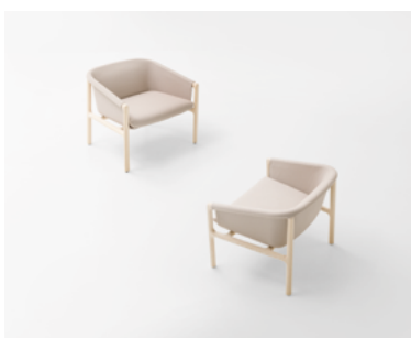
Charlotte , design Vincent Van Duysen

Chaise avec accoudoirs et petit fauteuil. La structure est composée d'une partie interne, en matière plastique thermoformée, et d'une partie visible en bois massif de frêne. Le rembourrage en mousse de polyuréthane est revêtu en Piqué, l'un des nombreux tissus exclusifs conçus et produits par Paola Lenti.