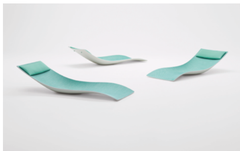
Sun , design Francesco Rota

Chaise longue monoscocca utilizzabile con o senza base in acciaio. La scocca portante stampata in Diade è sagomata per assumere una forma armoniosa ed ergonomica e accogliere naturalmente la persona offrendo una posizione di totale relax. Sun è stata concepita per poter essere inserita con semplicità in contesti differenti: nelle spa e nei centri benessere degli hotel, a bordo di piccole e grandi imbarcazioni, nelle piscine e nei giardini pubblici e privati.