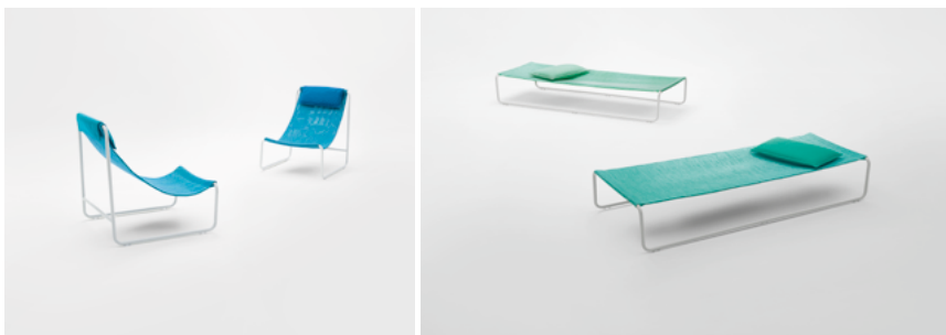
Hammock , design Rene Gonzalez Architects

Fauteuil et lit de repos en acier inoxydable verni, revêtement fixe en tissu Maris ou, pour le fauteuil uniquement, constitué d'un filet formé d'anneaux en corde Rope assemblés à la main. Le fauteuil et le lit de repos peuvent être rendus encore plus confortables avec des appuie-tête en polyuréthane et fibre de polyester recyclé, revêtus des tissus d'extérieur de la collection dans des coloris assortis à la fois à ceux du tissu Maris et de la corde Rope, et à ceux des structures en acier.