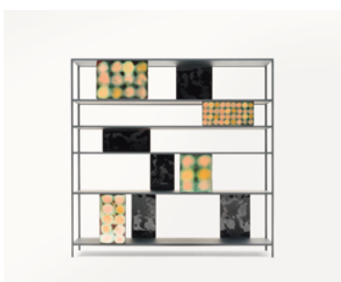
Intermezzo , design Francesco Rota

Étagère avec structure en acier et aluminium vernis. Les plans sont espacées les uns des autres par des panneaux de cuivre émaillés à la main avec des motifs abstraits et des coloris obtenues avec un mélange de poudres et de pigments.