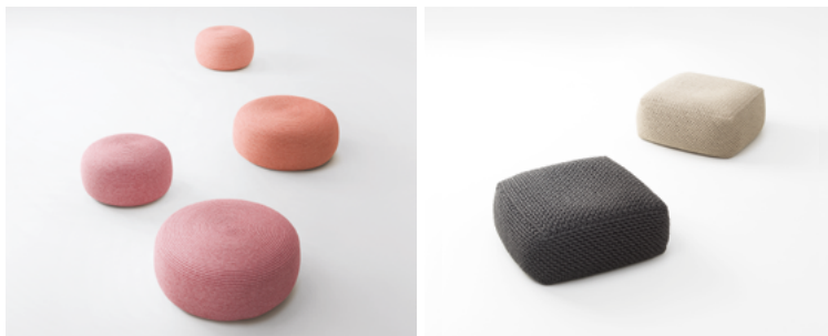
Otto, Picot , design Paola Lenti CRS

Pouf réalisé en cousant en spirale (Otto) ou crochant (Picot) des cordes de lin ou de chanvre. Le rembourrage peut être naturel - en latex, fibre de paineira et feutre de laine - ou synthétique, en fibre de polyester recyclé et polyuréthane ou en microsphères de polypropylène.