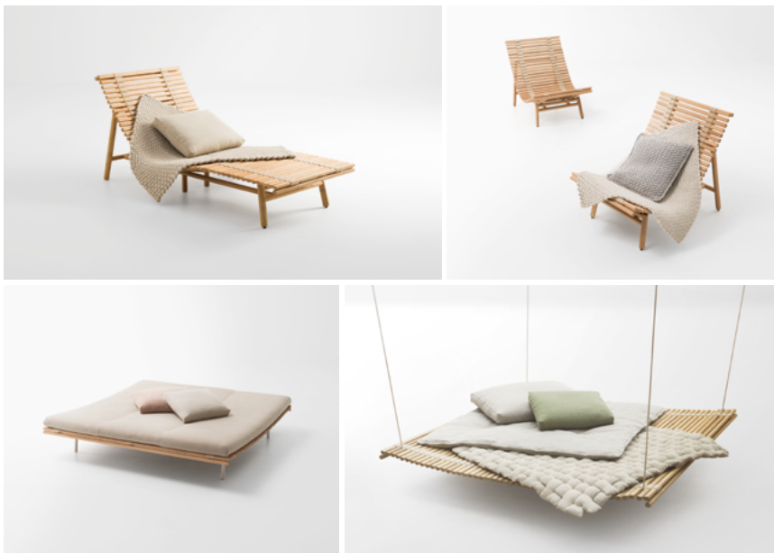
Shibui , design Francesco Rota

Fauteuil, chaise longue, plateforme au sol et plateforme suspendue. La structure Shibui est en bambou tourné, les surfaces d'assise et de dossier sont composées de tiges de bambou liées entre elles par des sangles de jute. Les plateformes au sol et suspendues prévoient l'utilisation d'un matelas à rembourrage naturel - en latex, fibre de paineira et feutre de laine - ou synthétique, en fibre de polyester recyclé et polyuréthane, revêtu de tissus de lin ou de chanvre.