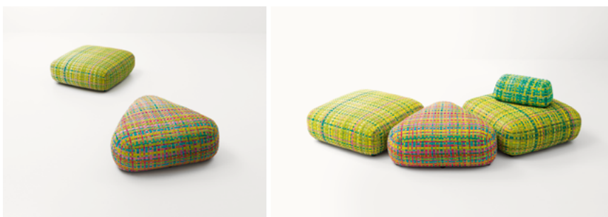
Millefiori , design Paola Lenti CRS

Pouf avec structure en acier rembourré de polyuréthane et fibre de polyester recyclé. Le revêtement est déhoussable et tressé à la main avec des cordes plates en fil Rope de différents coloris. Les poufs Millefiori peuvent être complétés par des dossiers librement positionnables.