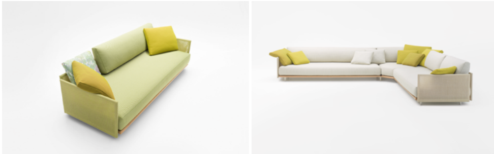
Harbour , design Francesco Rota

Fauteuil, canapé, éléments modulaires, chaise longue et pouf. Des panneaux recouverts de tissu Maris sont appliqués sur la structure en acier et en bois de sassafras et deviennent ainsi des dossiers et des accoudoirs. Les coussins sont fabriqués en grande partie avec de l'Aerelle® blue, la fibre entièrement recyclée avec laquelle Paola Lenti a décidé de rendre éco-durables tous les tissus d'ameublement de ses collections d'intérieur et d'extérieur. Le revêtement des coussins est déhoussable et disponible dans les nombreux tissus exclusifs proposés pour l'extérieur.