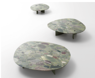
Isole , design Marella Ferrera

Série de petites tables avec plateau en Marinace et base en acier inoxydable verni poli. Aux plateaux traditionnels en Pietra di Comiso, s'ajoutent maintenant des plateaux obtenus à partir d'un granit d'origine volcanique aux effets chromatiques surprenants.