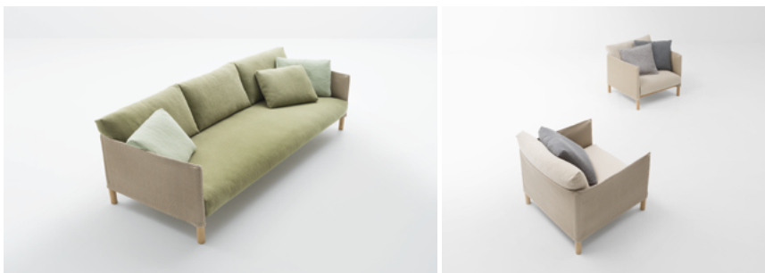
Vespucci , design Francesco Rota

Fauteuil et canapé deux et trois places. La structure en acier et bois de sassafras est pourvue d'un revêtement structurel en Spago, un tissu obtenu par le tissage d'une ficelle de lin. Ce revêtement, qui peut être facilement enlevé si nécessaire, contient les coussins d'assise et de dossier, disponibles avec un rembourrage naturel - en latex, fibre de paineira et feutre de laine - ou synthétique, en fibre de polyester recyclé et polyuréthane, et recouverts de tissus de lin ou de chanvre.