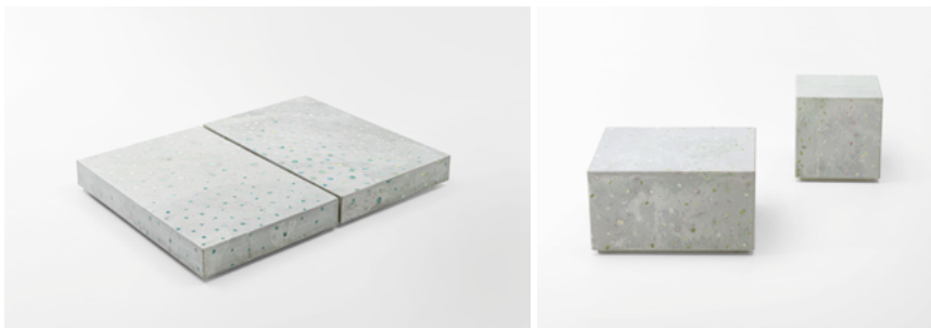
Marna , design Paola Lenti CRS

Série de petites tables disponibles en différentes dimensions en Opus, une surface en béton moulée et décorée d'une mosaïque de verre recyclé.