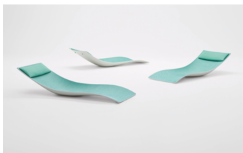
Sun , design Francesco Rota

Chaise longue monocoque utilisable avec ou sans base en acier. La chaise longue formée en Diade est façonné pour prendre une forme harmonieuse et ergonomique et accueillir naturellement la personne en offrant une position de détente totale. Sun a été conçu pour être facilement inséré dans des contextes différents : dans les spas et centres de bien-être des hôtels, à bord de petits et grands bateaux, dans les piscines et dans les jardins publics et privés.