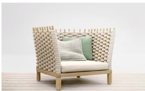
Wabi , design Francesco Rota

Fauteuil, canapé et balancelle. La nouvelle version d'un classique de la collection outdoor de Paola Lenti combine la structure en bois de sassafras avec un revêtement fixe tressé à la main en corde de lin. Les coussins sont disponibles avec un rembourrage naturel - en latex, fibre de paineira et feutre de laine - ou synthétique, en fibre de polyester recyclé et polyuréthane, et sont revêtus de tissus de lin ou de chanvre.