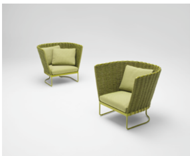
Ami , design Francesco Rota

Chaise, fauteuil et canapés disponibles en différentes dimensions et finitions. L'un des produits qui représente le mieux la pensée de Paola Lenti pour l'extérieur est aujourd'hui renouvelé à travers le nouveau revêtement en corde Twiggy, comme toujours entièrement tressée à la main, combiné avec des structures en acier inoxydable verni brillant dans les coloris de la collection.