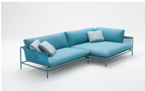
Canvas , design Francesco Rota

Présenté pour la première fois en 2009, Canvas est un canapé d'extérieur modulaire au design intemporel. Paola Lenti le propose à nouveau aujourd'hui dans une version renouvelée, dans laquelle Maris est utilisé, grâce à la robustesse de sa structure, comme tissu de support pour accueillir les coussins et les dossiers des sièges. La vaste gamme de teintes disponibles peut être coordonnée avec tous les tissus d'ameublement de la collection outdoor et avec les vernis brillants et opaques des structures en acier, dans un jeu de combinaisons de couleurs presque illimité.