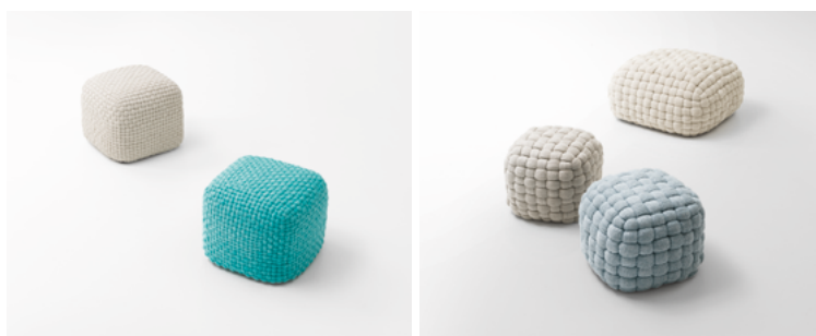
Duvé, Tobit , design Paola Lenti CRS

Poufs de différente dimension et forme, coussins et matelas en maille tubulaire de lin tissée à la main. Le rembourrage peut être naturel - en latex, fibre de paineira et feutre de laine - ou synthétique, en fibre de polyester recyclé et polyuréthane ou en microsphères de polypropylène.