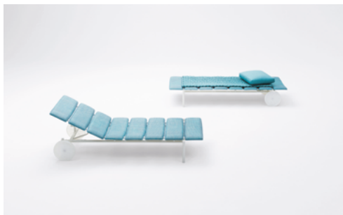
Miramar , design Francesco Rota

Lit de repos en acier inoxydable et lattes structurelles portantes formées en Diade. Pratique et fonctionnel, le lit de repos Miramar est équipé d'un dossier réglable en quatre positions et de grandes roues en plastique qui facilitent son déplacement.