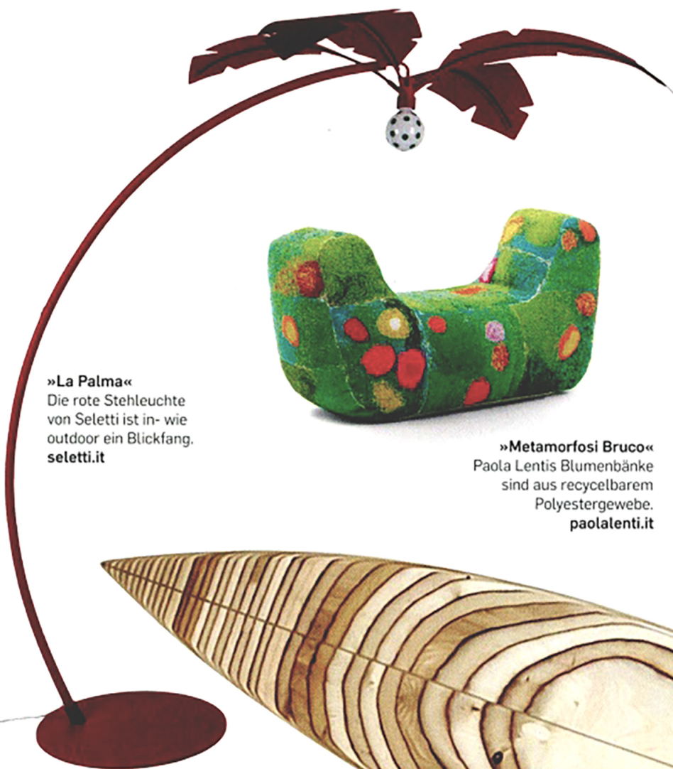
»La Palma« Die rote Stehleuchte von Seletti ist in- wie outdoor ein Blickfang. seletti.it

Farben feinsten französischen Jetset-Glamour der 50er-Jahre. Damit man Meer und Strand auch indoor spüren kann, entwarf Design-Ikone Kelly Wearstler, inspiriert von der Pazifikküste, das »Pacific Short Board« aus Holz, das durchaus Teil einer Kunstsammlung sein könnte. Von Leichtigkeit zeugt auch der edgy In- und Outdoor-Stuhl »In-side« von Architekt und Designer Thomas Heatherwick für Magis. Mit der vielseitigen Kollektion will man die Grenzen überschreiten und dreht dabei das Innen nach außen. Das Polyäthylen besteht teilweise aus recyceltem Material, jedes Stück wird durch die individuelle Mischung der Seitenfarben zum Unikat. Summer, here we come! <