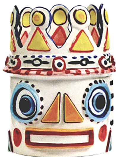
»Sicily-Vasen« Die farbenfrohen Gebilde begeistern in vier verschiedenen Ausführungen. serax.com