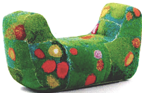
»Metamorfosi Bruco« Paola Lentis Blumenbänke sind aus recycelbarem Polyester-gewebe. paolalenti.it