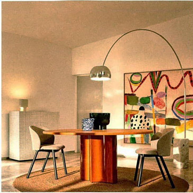
ZANOTTA, Bol table by Zaven Design, Daisy chairs by Mist-o