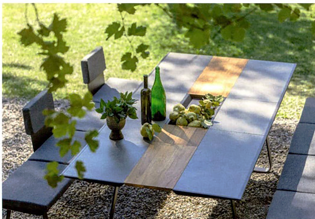
EGO PARIS, Extradados table and benches - egoparis.com

The trend towards customisation is also making itself felt in the world of tables, and within a single collection you can often define your own criteria. At Extradados, the tops can be chosen in ceramic or Corian, while the central table runner is available in aluminium, teak or Corian. Mixing materials is very much the order of the day and aluminium and steel are often combined with wood (Fast). At Paola Lenti, small round coffee tables can be joined to a rectangular coffee table to enlarge it. At Gandia Blasco, the tables are collected together to create an archipelago. ▷