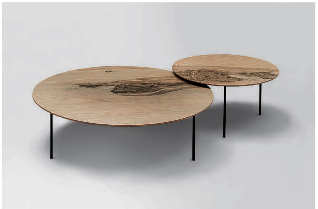
PAOLA LENTI, Elio tables - paolalenti.it