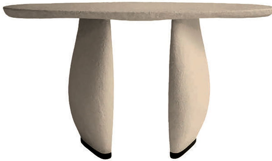
BIOBJECT, Air collection, Dolomie table, design Joëlle Rigal - biobject.com