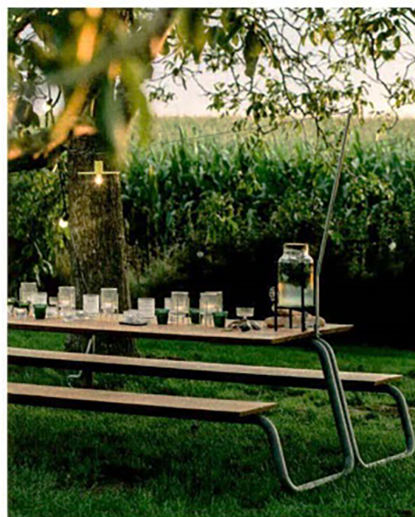
WUNDER, The Table - wunder.be