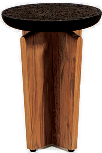
ETHIMO, Cross occasional table, design Patrick Norguet - ethimo.com

The exploration of poor materials such as papier-mâché requires hand-modelling on a wood and cardboard base to shape massive and supple forms, without generating any waste, evoking a mineral relic. FSC® teak, heat-treated oak, natural or ecologically roasted cork are all textures that are suitable for outdoor use. When it comes to the material, economy is factored in from the very first sketches of the designer. One example is the insertion of a linen cloth between two wooden parts to obtain resistant, finer and stable surfaces. □