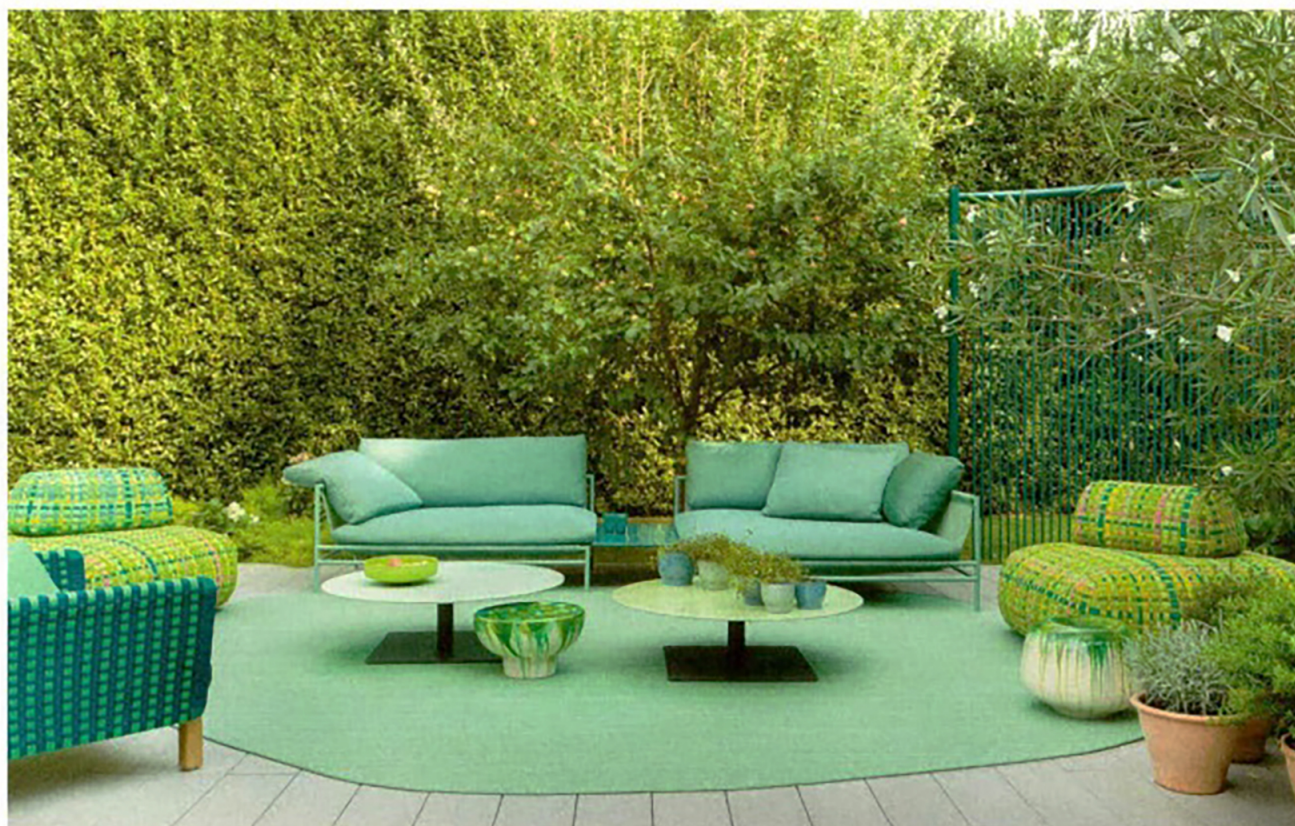
PAOLA LENTI, Giro collection, tops by Nicolo Morales - paolalenti.it