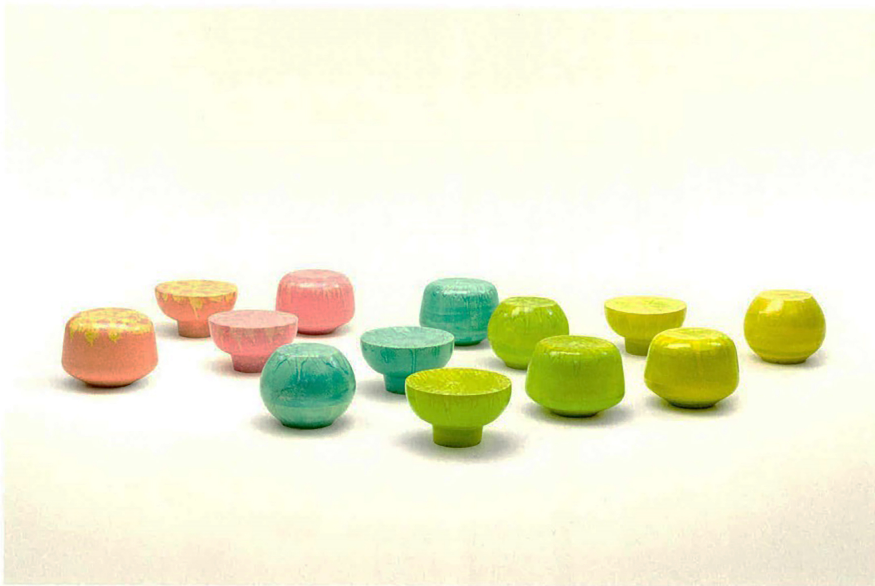
Calatini collection © Paola Lenti srl © Sergio Chimenti