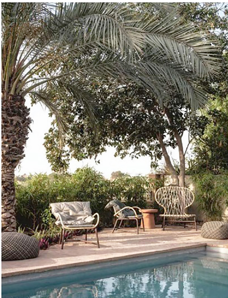
Alle meubilair: Baxter. Poefjes: Paola Lenti.