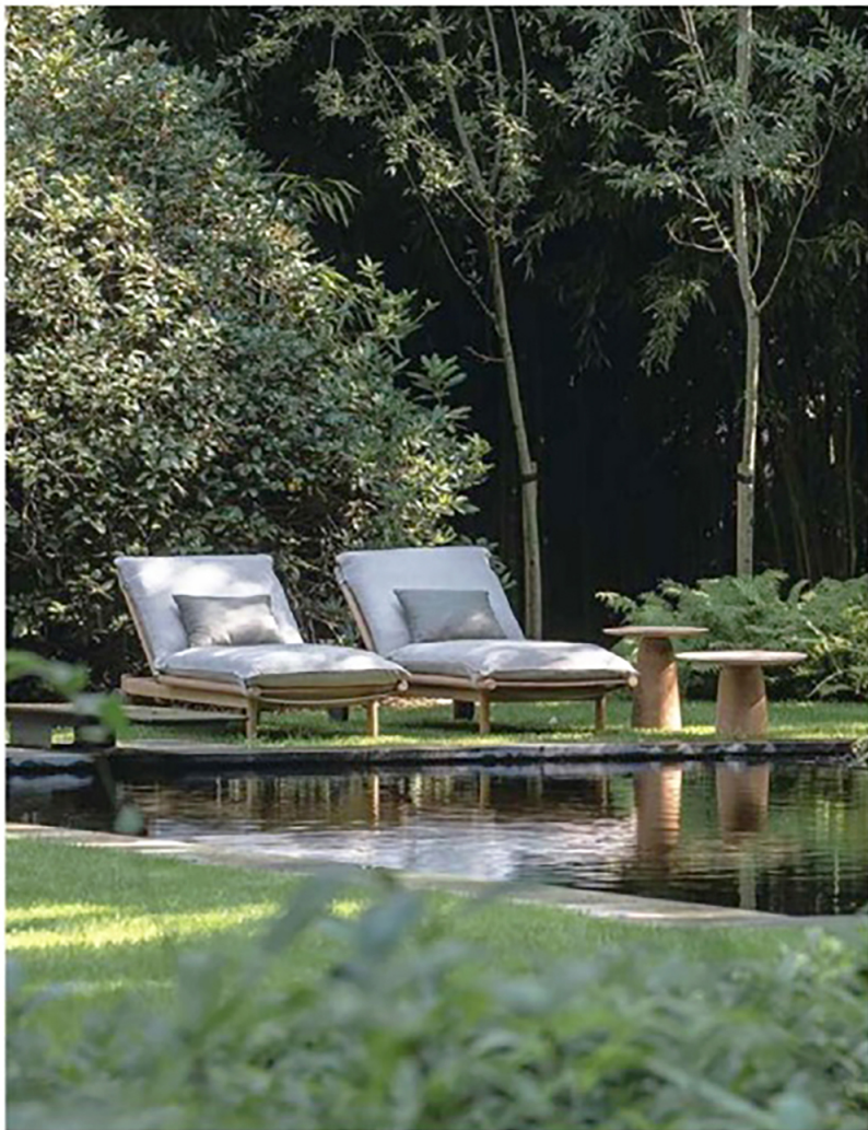
Ligbedden: 'Tibbo' van Dedon. Kussens: maatwerk van La Patronne. Bijzettafeltjes: 'Dunes' van Tribù.