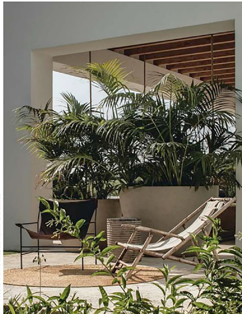
Potten: Atelier Vierkant. Ligstoel: vintage. Leren fauteuil: Baxter.