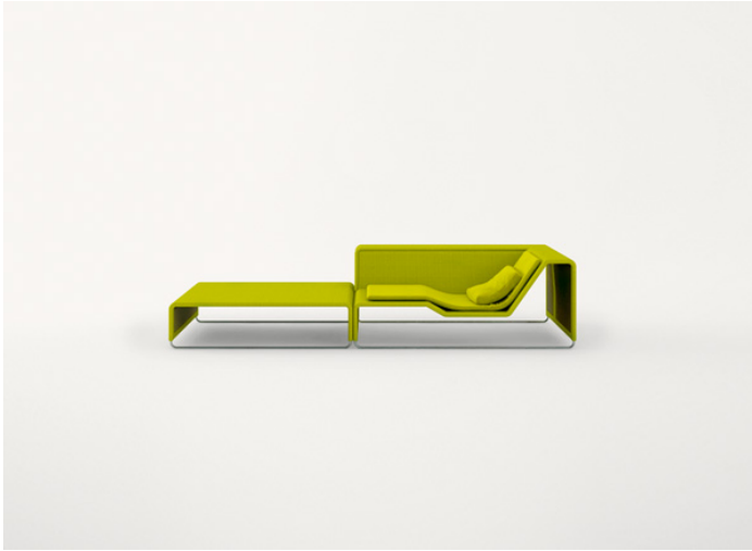
B11PB + B11CLD