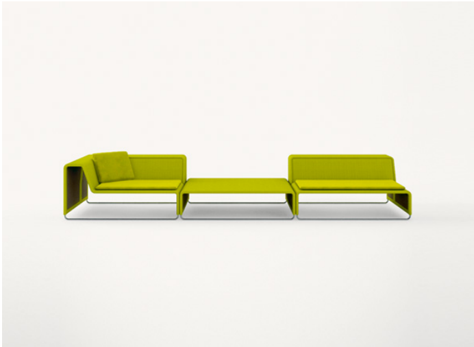
B11S + B11PB + B11C