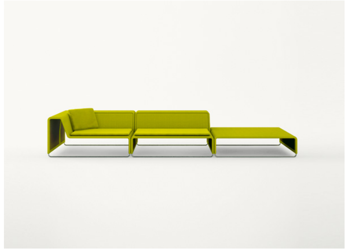
B11S + B11C + B11PB