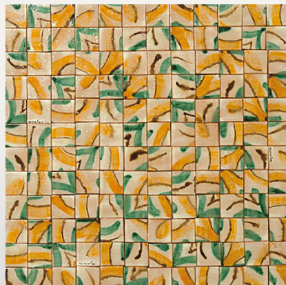
PMS112, maiolica acquerellata/watercoloured majolica cm 3,5x3,5