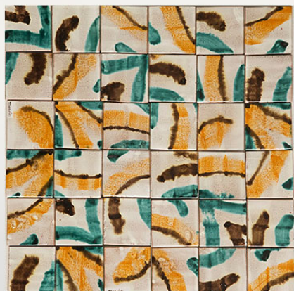
PML112, maiolica acquerellata/watercoloured majolica cm 7x7