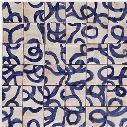
PML032, maiolica acquerellata/watercoloured majolica cm 7x7