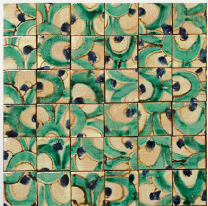
PML122, maiolica acquerellata/watercoloured majolica cm 7x7