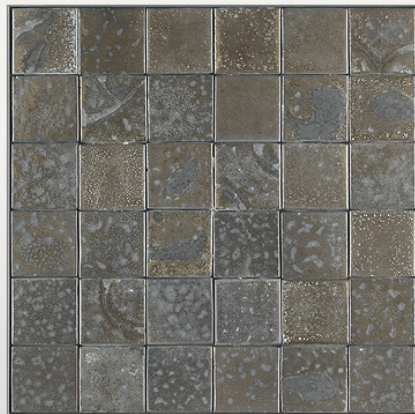
PMD121, majolica dipinta con colori ossidati/Majolica painted with oxidized colours cm 7x7