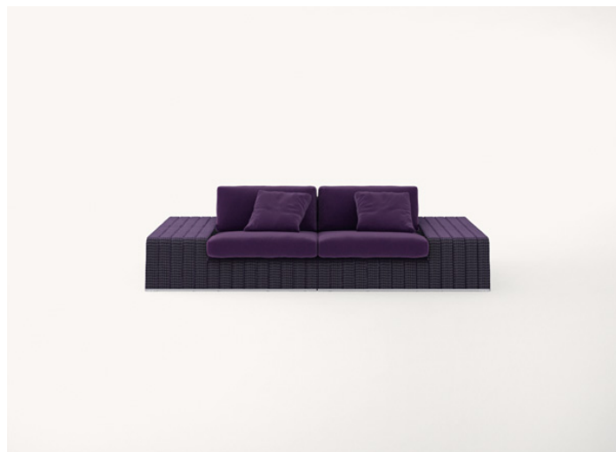
B18SCTS + B18SCTD