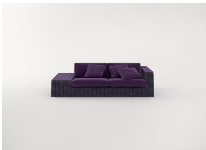
B18SCTS + B18SD