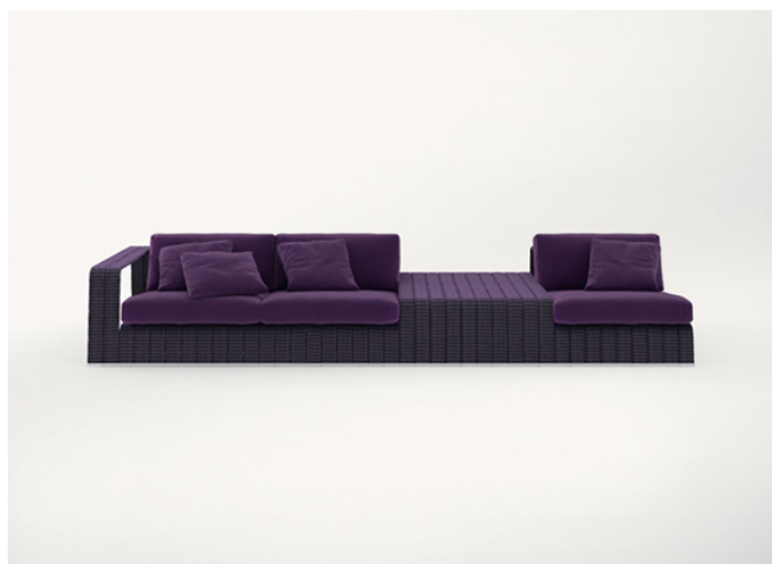
B18SS + B18SCTD + B18SCTS