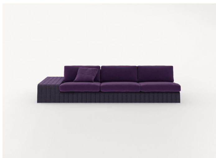
B18SCTS + n° 2 B18SC