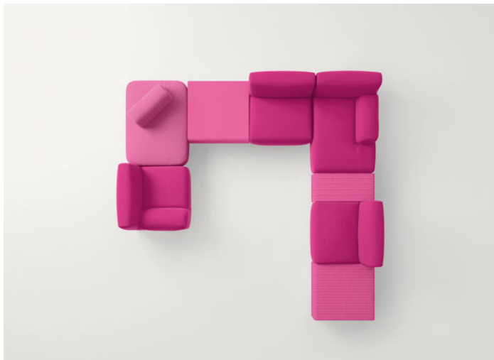
B87AE + Jolly pouf B68B + Orlando B77E + Island side table B11PA + B87CE + B87EE + Frame side table B18K + B87CE + Frame side table B18J