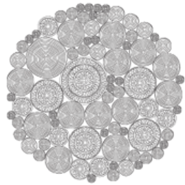
cm Ø 250 98"