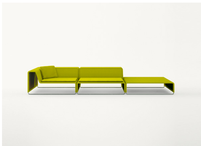
B11S + B11C + B11PB