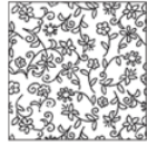
TAFLO1 lana / Wool TAFLO1S seta / Silk