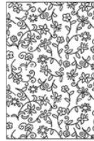
TAFLO4 lana / Wool TAFLO4S seta / Silk