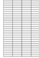
cm 200 x 300 79" x 118"