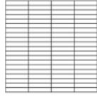
cm 200 x 200 79" x 79"