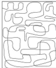
cm 200 x 240 79" x 94"