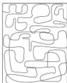
T40S05 single layer T40D05 double layer