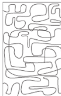
T40S06 single layer T40D06 double layer