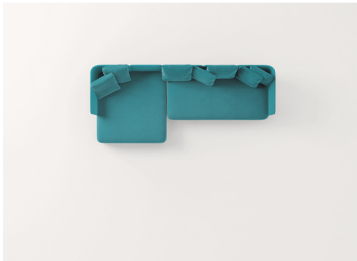
B25M + B25SCS + n° 3 B25SCA + B25N + B25SCD