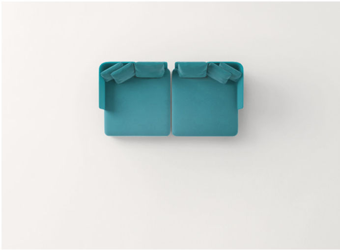
n° 2 B25M + B25SCS + n° 2 B25SCA + B25SCD