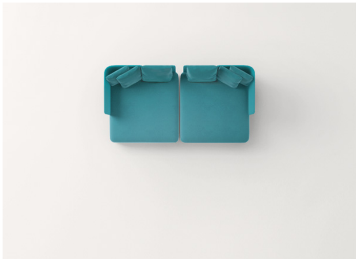
n° 2 B25M + B25SCS + n° 2 B25SCA + B25SCD