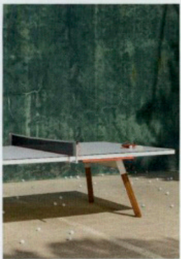
Witte pingongtafel van RS Barcelona.