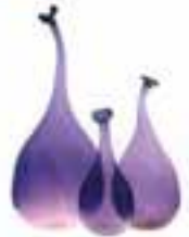
Cam vazolar: 375- 575 Euro, Nicot.