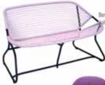
Ferrobis marka Bianco Sotiles banyo koltuğu: 490 Euro, Hass: