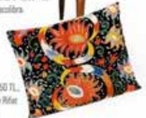
Yastık: 450 TL, Yastık By Pifaf Özbek.