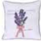
Yastık: 49 TL, Tape Home.