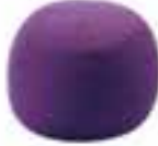
Paola Lenti marka Otto yastık: 1.012-1.462 Euro+KDV, Mizaik.