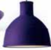
Unfold aydınlatma: 175 Euro+KDV, Nordliet.