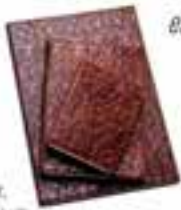
Defter, fiyan belli değİ, Arneggen.