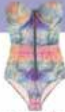
Diriy Tali marka mayo: 400 TL, Bilstone.