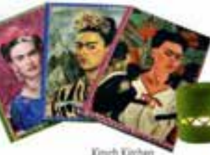
Kışık Kışıkten, hem Frida Kahlo portre başlık tasarımları hem de Meksika stilini yansıtan tasarımlarıyla biliniyor.