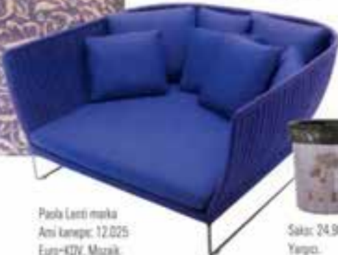
Paola Lenti marka Ami kanepe: 12.025 Euro+KDV, Mizaik.