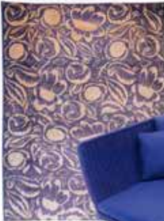
Zalenski marka yün ipek karpım halk (215x307 cm.): 12.470 Dolar, Labirent Konsept.