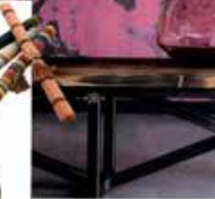
Pastel Lenti marka Sika aksesuar: 812-1.237 Euro+KDV arasında değİyor, Muzak.