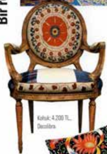
Koltuk: 4.200 TL, Decolibra.