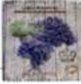
Dekoratif panel: 40.50 TL, Mudo Concept.