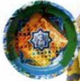
Tanki Çengir tasarımları hamamcazı: 260 TL, Ark of Crafts.