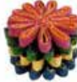
Bardak altlığı: 35,95 TL, Zana Huma.