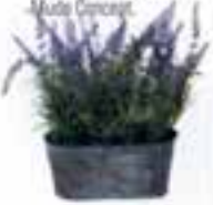
Saksılı lavanta: 80.50 TL, Mudo Concept.