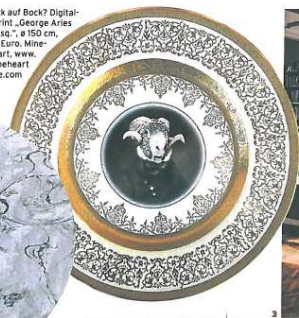
Bock auf Bock? Digital-print „George Aries Est.“, # 150 cm, 852 Euro. Mineheart, www.mineheartstore.com