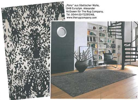
„Pony“ aus tibetischer Wolle, 1348 Euro/qm. Alexander McQueen für The Rug Company, Tel. 0044-20-72295146, www.rugcompany.com