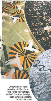
„Moonstone“, handgefertigt, Größe, Form und Farbe frei wählbar, ab 900 Euro/qm. Solists, über Simons Concepts, Tel. 0171-7631551